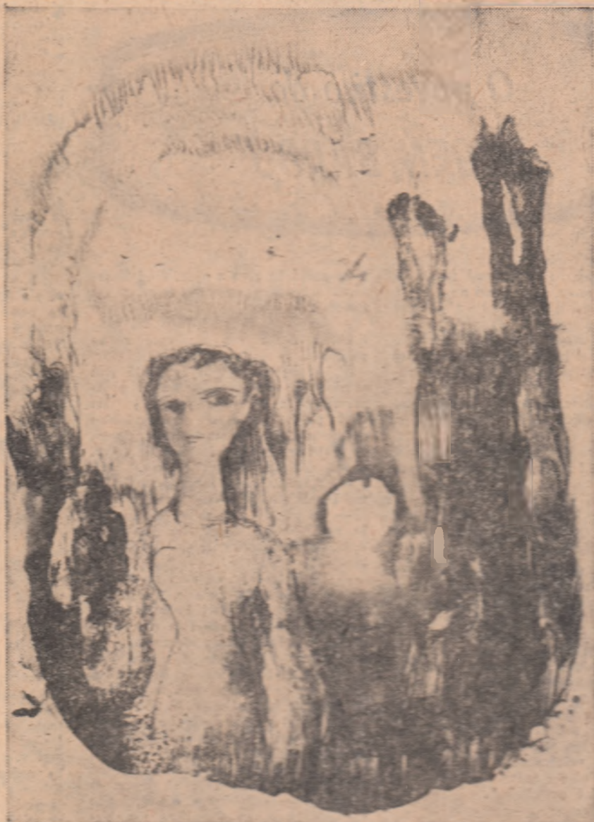
ILUSTRAȚIE LA VERSURI DE TUDOR ARGHEZI