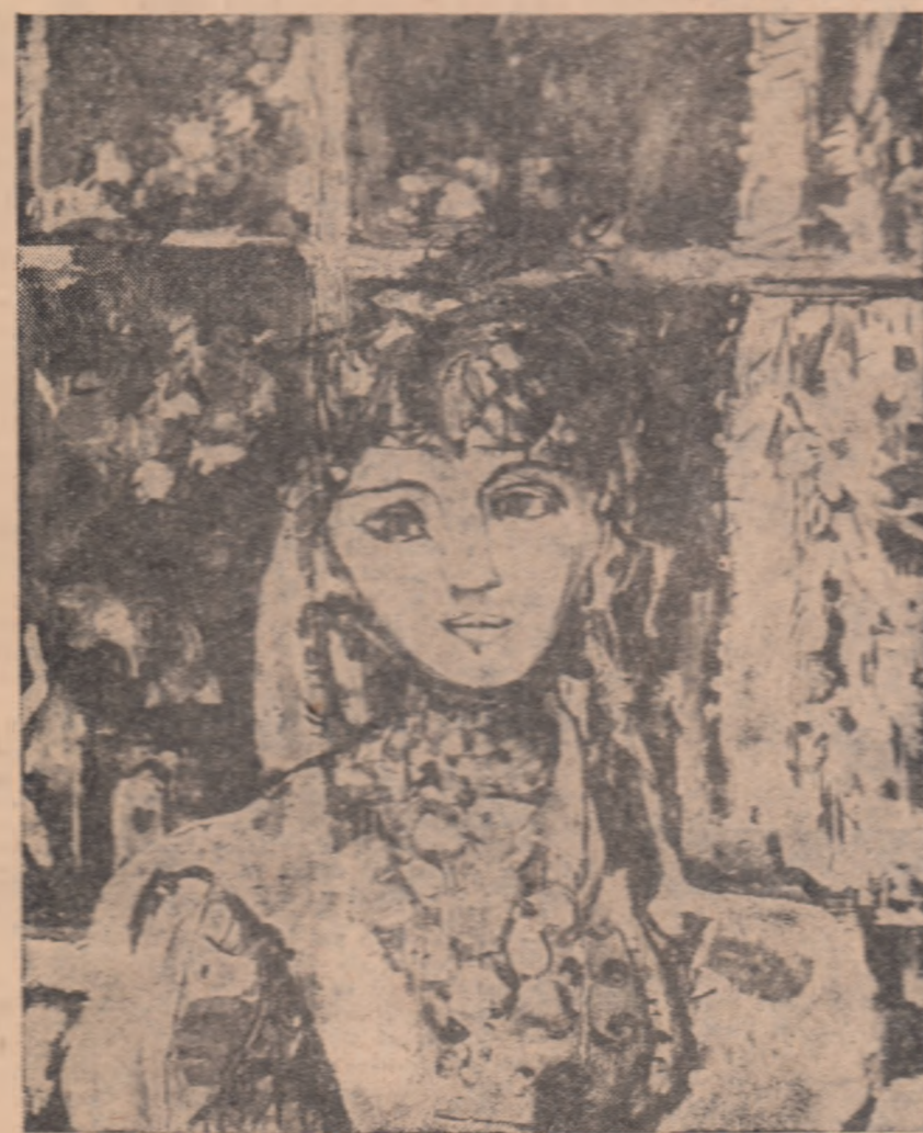
FATA CU SALBA