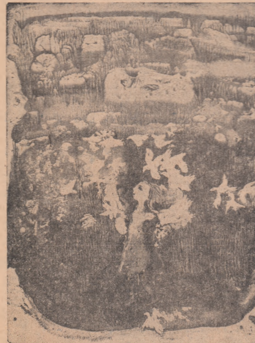
FETIȚA CU PASARELE