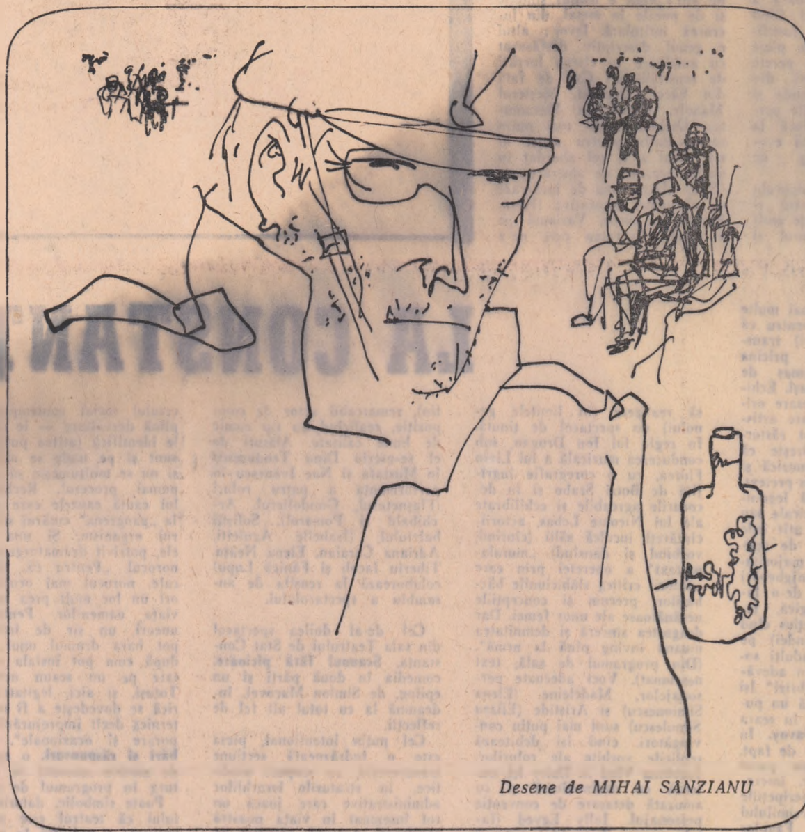
Desene de MIHAI SANZIANU

și tot ce s-a petrecut s-a întîmplat din pricina groazei. Se duc, prin urmare, ies de-acolo și văd un călăret. Turc, turc, ce mai. Turc s-a, cu fes roșu, cu itaganul în mină. Odată-și împintenează calul și se năpustește spre ei fluturînd itaganul prin aer.