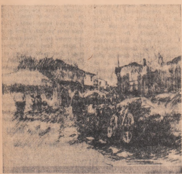
N. GRIGORESCU — CONVOI DE CARE

...Sau lumina este frumusețea lor. Culo- rilor cu care coboară de la izvoare li se adaugă dimensiunile și formele. La Săvinești turle și retorte și frumusețe fără seamă topită în ghemul urșilor de reion-rolan. E o frumusețe luminoasă, cal- mă și sigură, împlinindu-se din aer și din apă ca-n niște incredibile vîrjitorii. Bistrița trece prin retorte și agregate cu lumina ei, cu puterea ei, cu albul și pă- mîntul ei, aminînd mereu albia ei de aur, pășările care-și moaie aripile în oglinzile ei, vaparele care o brăzdează la Bicaș, pikhameralele care sfredeliesc drumuri spre comori. Și pe urmă lumina și frumusețea urcă pe vînticică la Piatra Neamț, la Bacău. Urca prin inimile entuziasților și prin gîndurile lor și, acolo, la sfîrșitul fiecărui bloc, la capătul fiecărui bulevard, în vînt ultimei note de pe partitură, în fra- mentul ultimei pagini de manuscris, înflo- reste. Și, firește, cu fiecare asemenea înflo- rire, Bistrița se naște încă o dată, de sute de ori, de mii de ori, mereu con- temporană cu noi, mereu izvorînd și din noi, mereu purtînd pe plutele ei, în fru- musețea ei, în lumina ei, viațelul noastre uimitor de îndrăzneț și uimitor de plina de poezie.