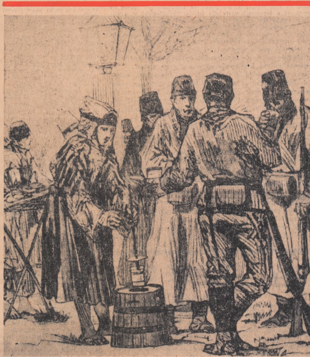
POPAS LA CRAIOVA AL MILITARILOR ROMÂNI, ÎN DRUM SPRE CALAFAT (1877) (Desen de A. LANÇON, trimis special al revistei „L'Illustration”)