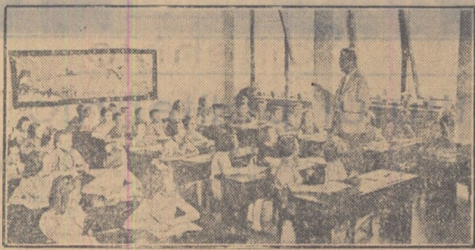
Într-o școală construită la Veltrusice în anii puterii populare.

Preocuparea multilaterală a statului pentru dezvoltarea copilului se manifestă și în grija pentru copiii de vîrstă preșcolară. Numărul grădinițelor a sporit față de 1948 cu 39 la sută. În perioada cincinalului, începînd din anul 1949 pînă în 1953, au fost înființate 1800 de grădinițe. Copiii se bucură aici de o îngrijire exemplară. O mare dezvoltare a cunoscut în anii puterii populare și învățământul superior. Astăzi există în Cehoslovacia 40 de instituții de învățământ superior, iar numărul studenților — aproximativ 50.000 — întrece de două ori numărul studenților din ultimul an universitar. În același timp, un număr de 22.000 de oameni ai muncii își completează cunoștințele sau își desăvîșesc instruirea în cadrul formelor de studiu prin corespondență, la cursurile serale etc. În timp ce în perioada republicii capitaliste cheltuielile statului pentru învățământ, scoțite pe cap de locuitor, constituiau doar 0,21 coroane, statul de democrație populară a alocat în acest scop, numai în cursul anului 1953, o sumă de aproape opt ori mai mare.