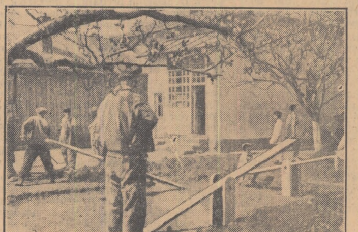
În clișeu din stînga: Terenul de joacă nici nu fusese terminat, cînd primii copii au și început să „încerce“ balansoarele. Dreapta: Cu flori și stegulețe spre fabrică, pentru a mulțumi muncitorilor.

Acum cîteva zile, copiii din grădinița de cartier nr. 6 din Capitală au primit un dar minunat: muncitorii fabricii din apropierea grădiniței, lucrînd cu drag în orele libere, le-au confecționat un mare număr de jucării și le-au amenajat un teren pentru jocuri, cu groapă de nisip, balansoare și leagăn. Vizita delegației muncitorilor care au adus jucăria a fost o adevărată sărbătoare pentru copii. Veseli, cu cîntece, fîrînd în miini buchețele de flori, copiii au pornit apoi spre fabrică, pentru a mulțumi muncitorilor pentru frumosul lor dar.