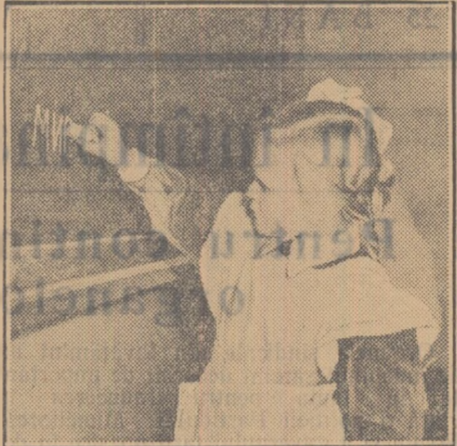
In clasa I-a a școlii nr. 144 din raionul Leningrad al capitalei Uniunii Republicilor Sovietice Socialiste.