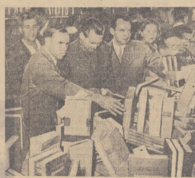
Aspect de la deschiderea Bazarului cărții sovietice din Capitală, organizat cu prilejul Lunii prieteniei romino-sovietice.