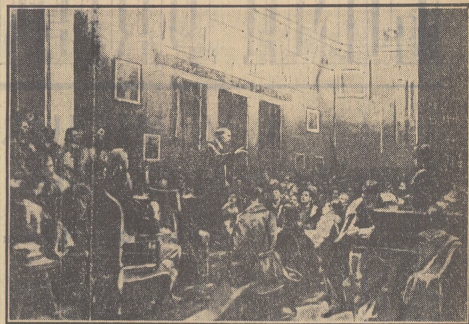
Lenin vorbind la Congresul al III-lea al Comsomolului.

Se împlinesc 37 de ani de la crearea Comsomolului, sprijinul de nădejde și rezerva de cadre a gloriosului Partid Comunist al Uniunii Sovietice.