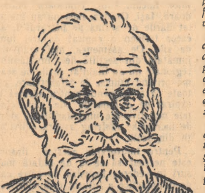
— 20 de ani de la moartea sa —