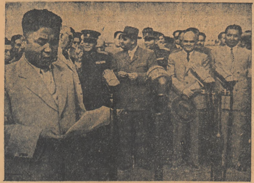
Tovarășul Kim Ir Sen rânduindu-și cuvântarea la sosirea pe aeroportul Băneasa.