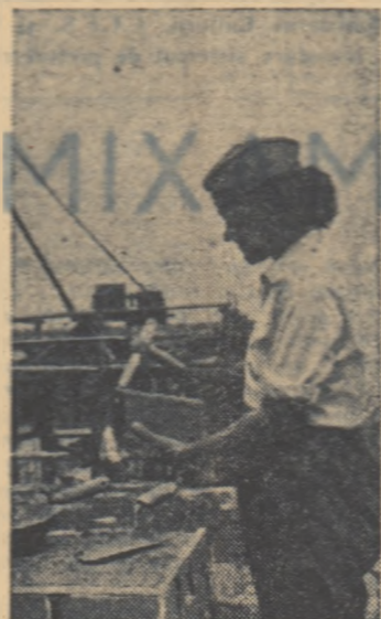
Pe șantierul lucrului de la Năvodari

In timpul vizitei Președintelui Tito au avut loc o serie de convorbiri între reprezentanții celor două guverne.