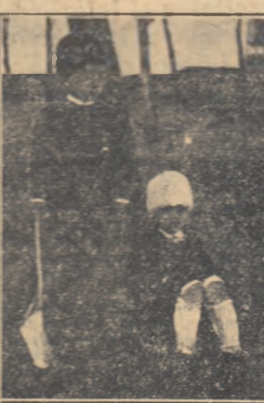
„Intirziții” de Gh. Iacob.