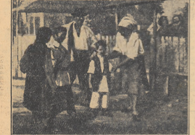
„Prima zi de școală”, de Petre Bedivan.