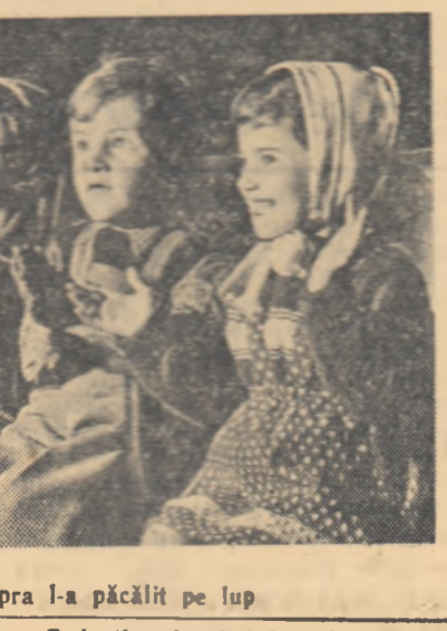
...și cînd capra l-a pălînit pe lup