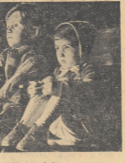
Cind lupul l-a mîscat pe iepure...

L A T E A T R U L D E P A P U Ș I D I N A R A D