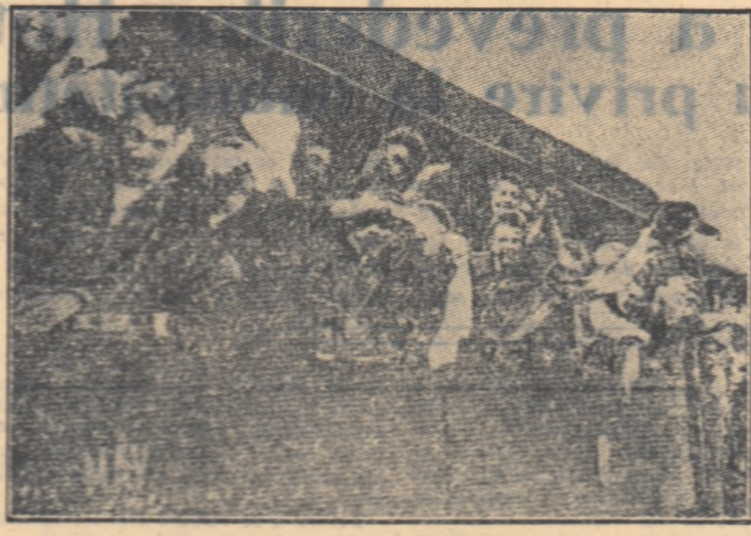
— Bun sose, oșpeți dragi! — Mulțumim! Drum bun și vacanță plăcută în țara noastră, dragi prieteni! — La revedere, prieteni scumpei! — Mulțumim pentru frățoșca găzduire!

— Acest schimb de salutații pornind din inimă sinceră, emoționantă prin simplitatea și sinceritatea lor, s-a petrecut cu două zile în urmă, pe personal Gării de Nord, marșar etanși al unei vesele și entuziaste încurcări de plecuri și sosiri; urca în trenuri pentru a se reintoarce în țările lor, după două săptămâni petrecute pe litoralul Mării Negre, în toatăria uneciloror români, 54 de oșpeți maghiari și alți 54 cehoslovaci; plecau să se reezeze pe malul lacului Balaton, în Ungaria. 54 de ucenici români, în timp ce alți 54 erau gata să le drumul spre Zilina și Gottwaldov, în Cehoslovacia, în sfârșit, izbora dis-cespresul internațional 54 de elevi și școlilor profesionale din Cehoslovacia, pești și petrecuți o parte din vacanța lor în tabăra internațională de la Vasile Roșie.