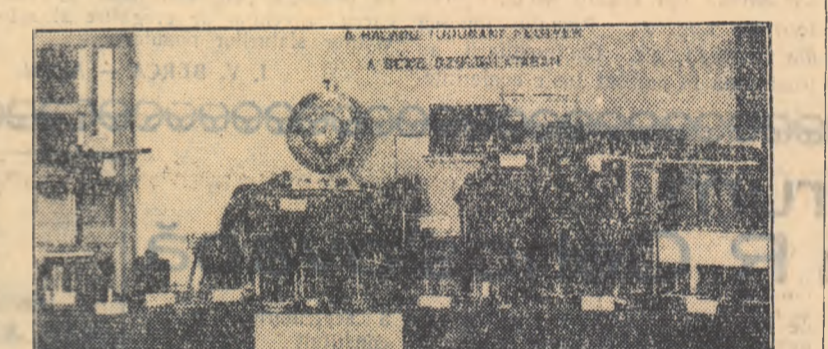
Aspecte de la expoziția atelierului de mecanică fină al Universității „Bolyai”-Cluj.

pronunțat izolat diferă de sonoritate față de pronunțarea lui în diverse combinații cu alte sunete.