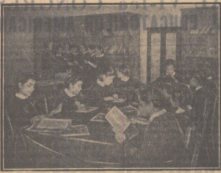
În biblioteca școlii medii nr. 3 din Craiova.