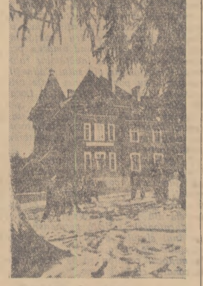
La Valea Putnei, în regiunea Suceava, în curtea sanatoriului pentru copii debili.