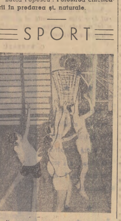
Antrenament de baschet la școala medie sportivă din București

De cînd, reprezentanța companiei cinematografice americane Metro-Goldwin-Mayer (M.G.M.), care furnizează filme indonezian și organizat la Bandung un „film-bal”? Ce este „film-bal”? O definiție precisă ar fi greu de găsit. Ceea ce se poate afirma însă cu toată siguranță este că avem de-a face cu o clară manifestare a „modului de viață american”. În cazul de față lucrurile s-au petrecut în modul următor. La hotelul olandez „Hongan”, organizatorii au pus la cale o distracție curaj americană; vizionarea unor filme americane decernarea de premii tinerilor invitate și a femeile de băutură, execuțarea de către jazz a stridentilor „rock and roll” și „boogie-woogie” și de către participanți a strîmbăturilor, zberetelor, mirotărilor și învîrtiturilor coreșpunzătoare. Efectul acestor serate dansante, străină obiceiurilor și moravurilor populare indonezian, a fost cu totul altul decît cel scontat de inițiatorii ei. Opinia publică indoneziană și-a manifestat în formă foarte variată indignarea față de această manifestare a culturii americane. Înfluentul ziar „Bintang Timur”, arătînd că balul cu pricina a constat în „dansuri prostesti și be-