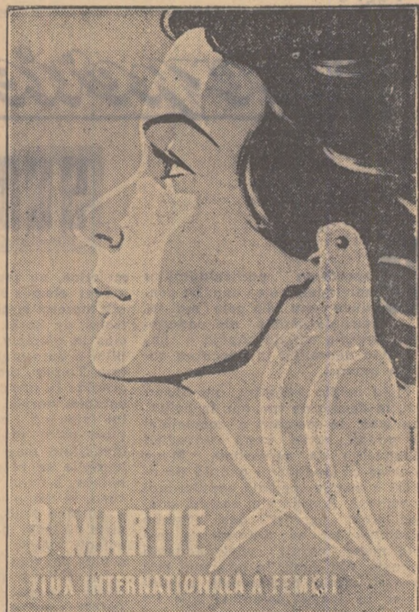
8 MARTIE ZIUA INTERNAȚIONALĂ A FEMEII