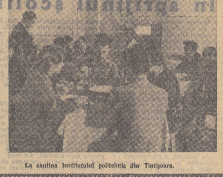
La cantina Institutului politehnic din Timișoara.