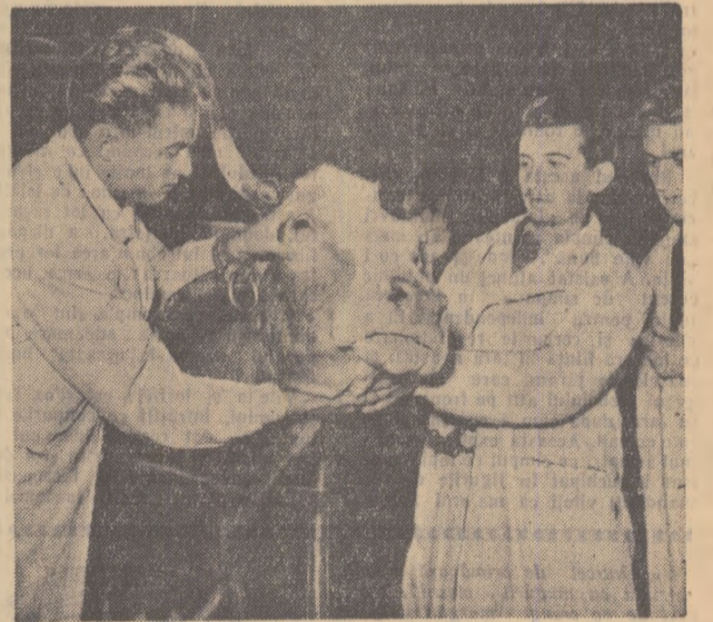
La Facultatea de medicină veterinară a Institutului agronomic din Arad.