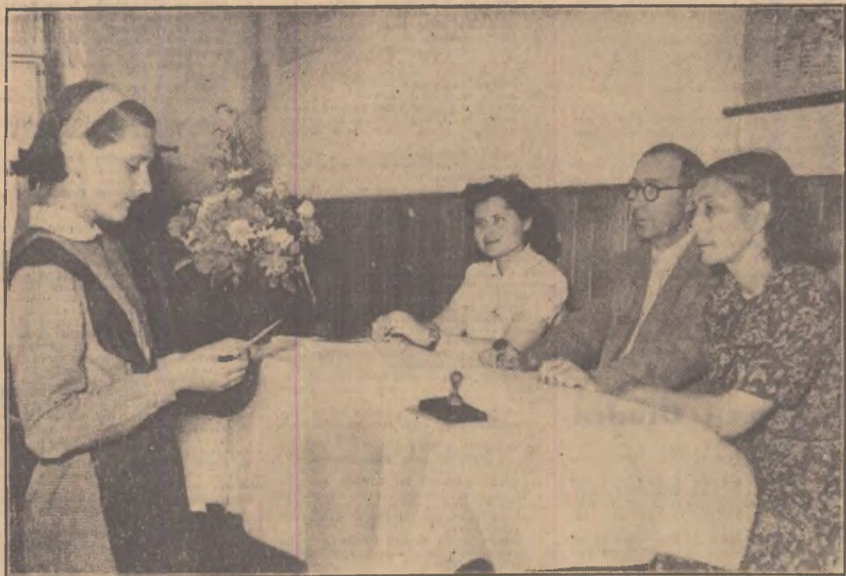
Biletul a fost tras! Din acest moment, fața în față cu întrebarea scrisă în bilet, nivelul cunoștințelor este cel care are cuvîntul. Emoția e, poate, la fel de mare și pentru examinatorul care-și vede acum rodul muncii de pregătire a elevilor în tot timpul anului școlar.