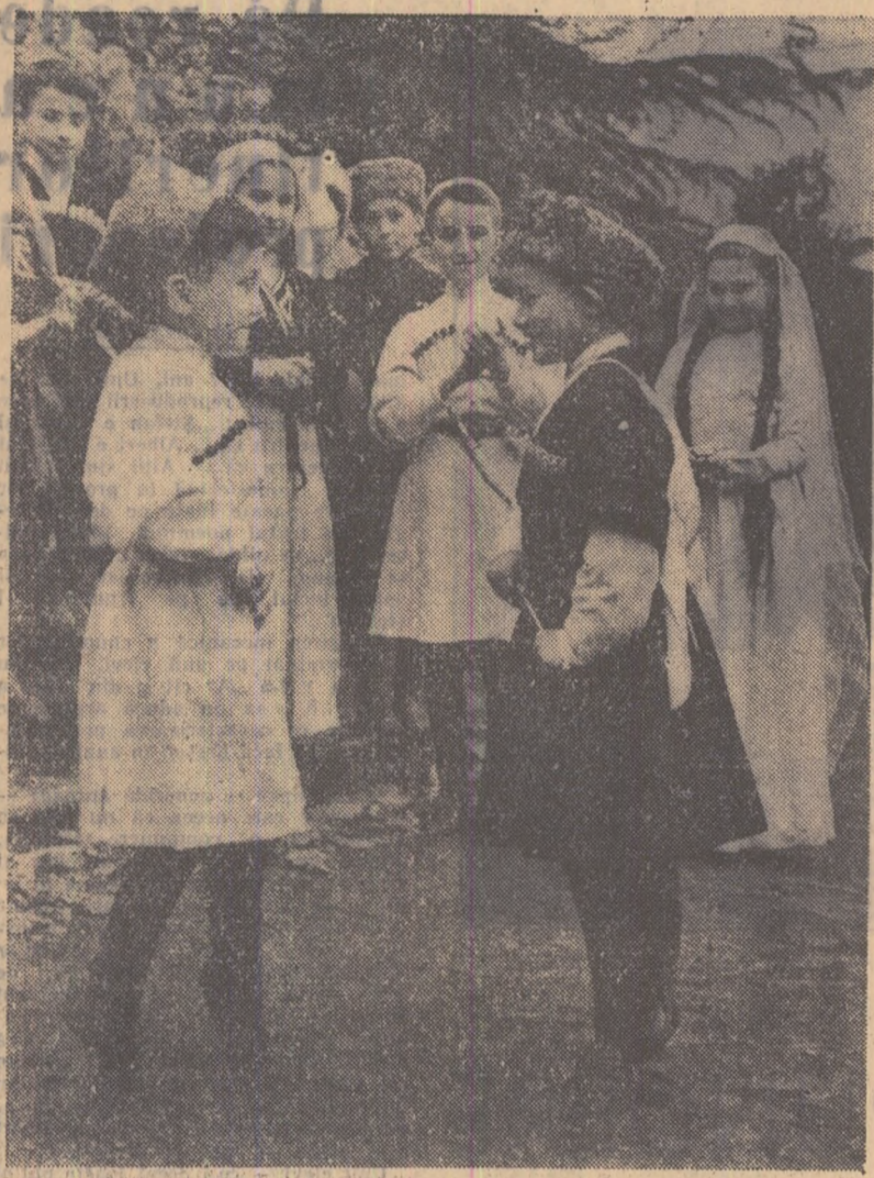
Cei mai tineri participanți gruzini la Festivalul de la Moscova repetă unul din dansurile lor naționale, îmbrăcați în tradiționalele costume de djighifi.