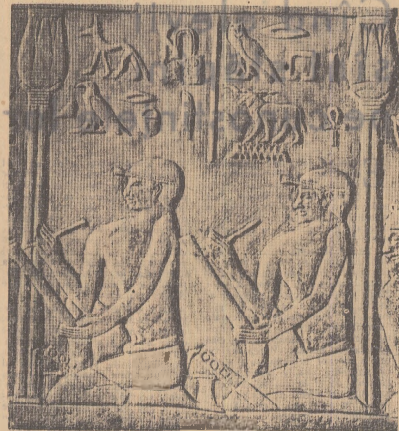
Scribi egipteni din timpul vechiului imperiu (3.200—2.250 î.e.n.). Basorelieful de pe mormîntul lui Mereuka din Saqqara.

Stringerea legăturilor dintre țările arabe este unul din obiectivele principale ale noului regim. Relațiile științifice și culturale dintre Egipt și țările orientale sînt întretinute prin schimburi de profesori, studenți și elevi, precum și prin organizarea în Egipt a unor congrese și expoziții internaționale. În universitățile din Cairo, Alexandria și Heliopolis se găsesc studenți din Iordania, Siria, Liban, Palestina, Tunis, Irak, Arabia Saudită, Yemen, Aden, Libia, Pakistan, Afganistan, Indonezia, Iran etc. Numărul studenților din țările orientale care învață în Egipt se ridică la peste 1200.