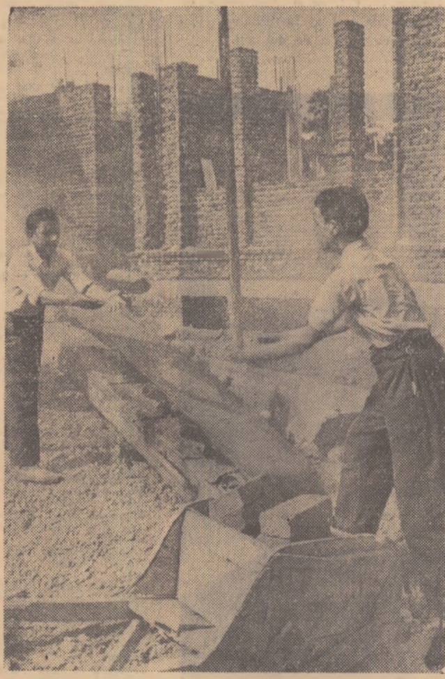
Elevii la școlii profesionale de ucenici C.F.R. pe șantier.