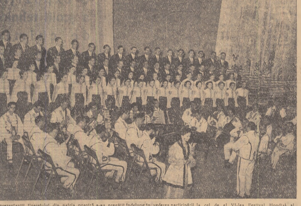
Reprezentanții tineretului din patria noastră s-au pregătit îndelung în vederea participării la cel de al VI-lea Festival Mondial al Tineretului și Studenților care se desfășoară anul acesta la Moscova.