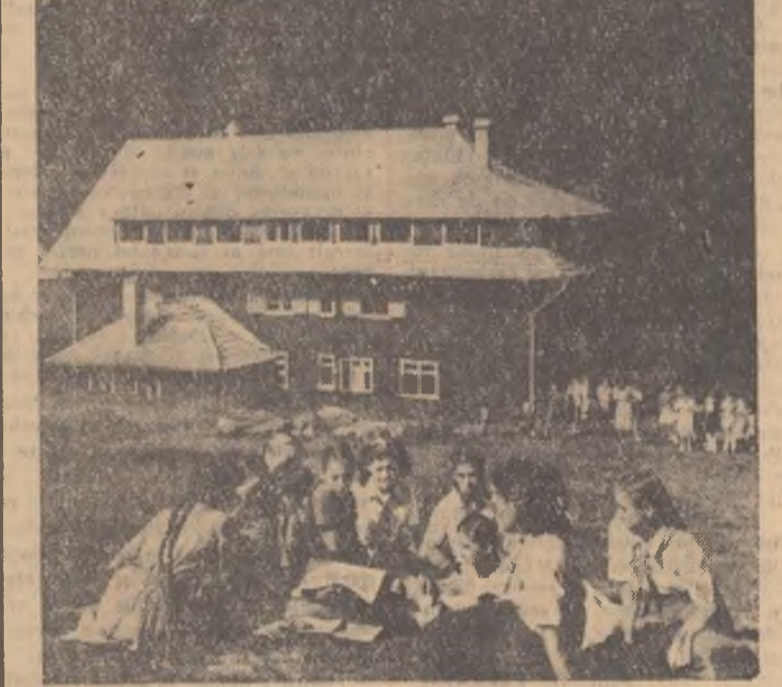
TABERELE... - raid anchetă