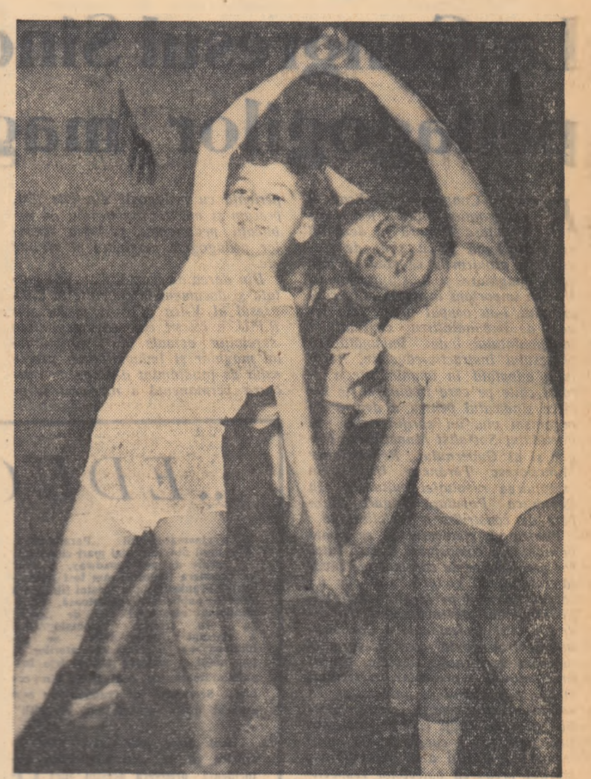
Într-o oră de gimnastică la școala medie nr. 15 din Capitală.

Pe lângă muncă de învățămînt de bază de la școala medie nr. 15 din Capitală, înțelegînd importanța pe care o are aprofundarea problemelor politice pentru activitatea pedagogică, s-a preocupat de a crea condiții pentru învățămîntul necesar studiului temei.