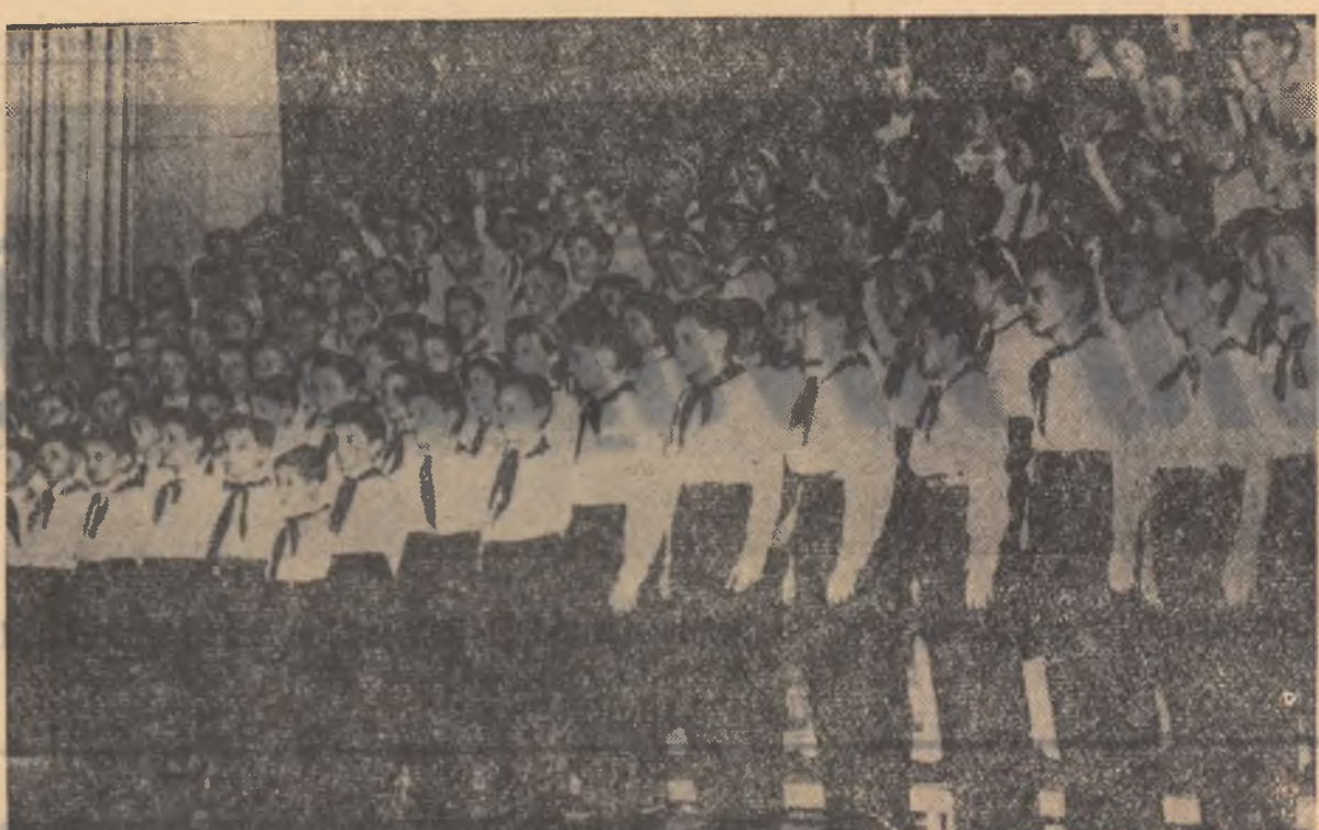
Corul mixt al școlii medii nr. 5 „Gh. Barițiu” și al școlii medii nr. 7 „Brassai Samuel” din Cluj.

În cadrul consfăturii pedagogice se vor analiza semestrial rezultatele muncii educative în general și, în special, formele și rezultatele muncii de educație patriotică.