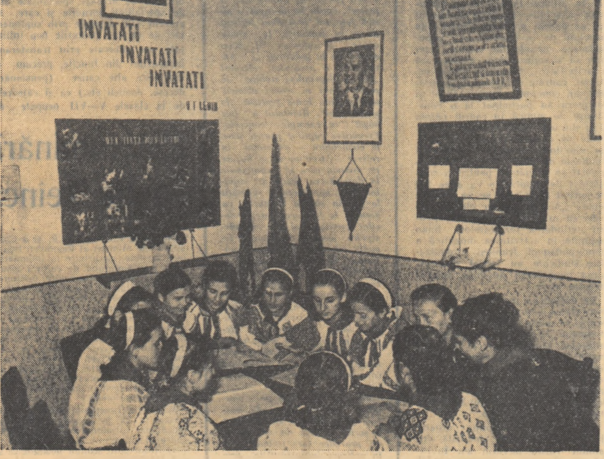
ȘEDINȚA COLECTIVULUI DE CONDUCERE AL DETAȘAMENTULUI discută felul cum se pregătesc pentru lecțiile pionierii școlii elementare din comuna Comani, raionul Drăgășeni.