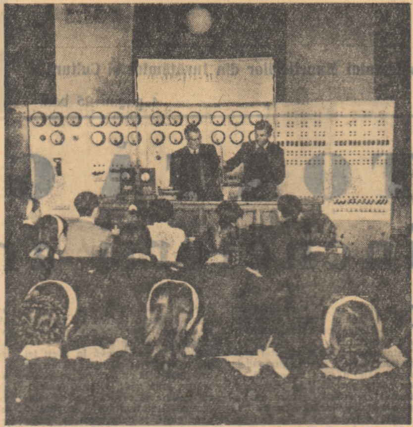
O lecție în laboratorul de radiofizică cu elevii anului I al școlii tehnice „Iosif Râmpoș” din București.