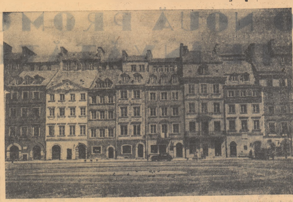
Plaja orașului vechi este din nou întregă

Construit cu multă simplitate, acest film, care va continua să ruleze săptămîna viitoare la cinematograful „Unită” și „Moșilor”, concentrează într-un emoționant episod dramatic o problemă a cărei soluționare este pe cît de originală pe atît de subtilă.