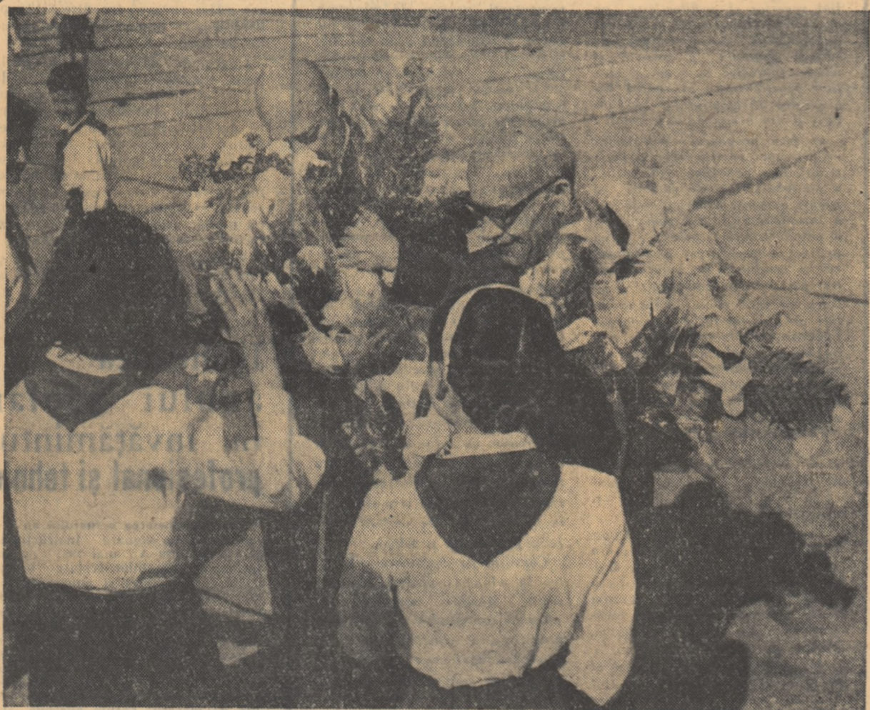
Pionierii oferă flori înalților oaspeți polonezi la plecarea din țara noastră.