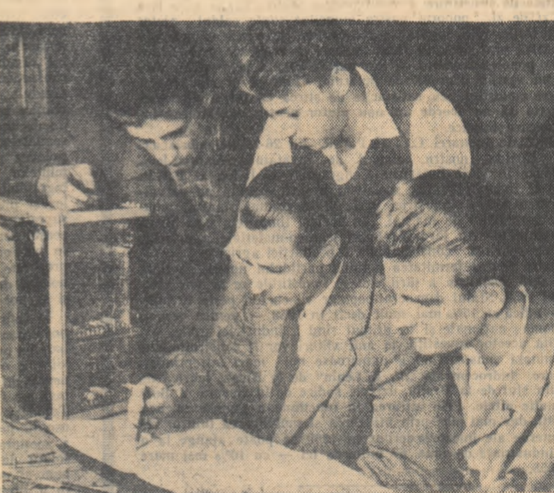
REALIZARILE VIITORILOR CONSTRUCTORI DE NAVE

Un fapt pozitiv relevat de responsabilii cercurilor metodice este intensitatea activității editoriale din acest an, care a dus la asigurarea cu manuale valoroase a școlilor care pregătesc cadre pentru cele mai importante sectoare de activitate economică. Totuși se constată încă, chiar și la unele manuale editate în ultimul timp, tendința de a expune materialul la un nivel care întrecă muncii pregătirea anterioară a ucenicilor, fără să țină seama de timpul efectiv pentru învățarea de care dispune cel cărora se adresează manualul. Un asemenea manual al cărui volum depășește posibilitățile de asimilare a cunoștințelor de către ucenici este, de exemplu, „Manualul electricianului”. Cele două volume ale acestuia însumează împreună aproape 700 de pagini. Manualele „Tehnologia lucrărilor pentru instalații electrice” sau „Tehnologia instalațiilor lumini forță” cuprind de asemenea noțiuni care depășesc nivelul de pregătire al ucenicilor.