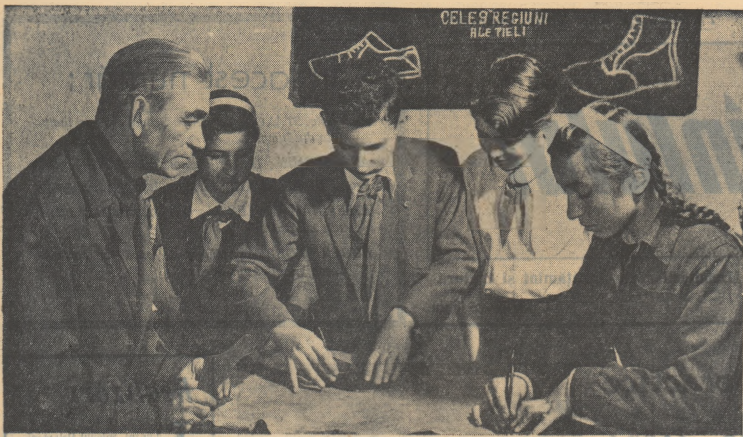
Primele noțiuni de eroziia a pământului