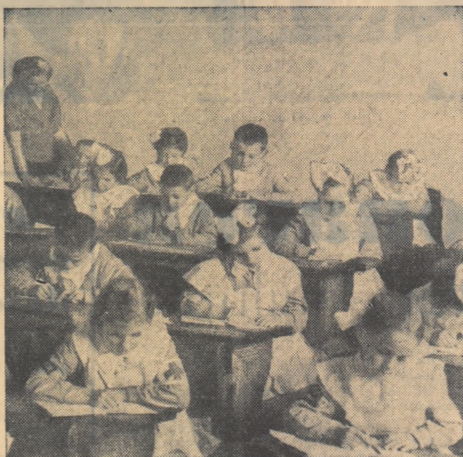
O oră de curs la clasa a II-a de la școala de 7 ani nr. 62 din Capitală.