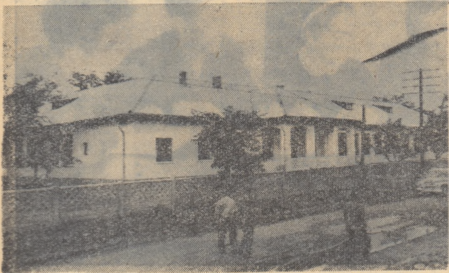
Noul local al Școlii medii din Moinești