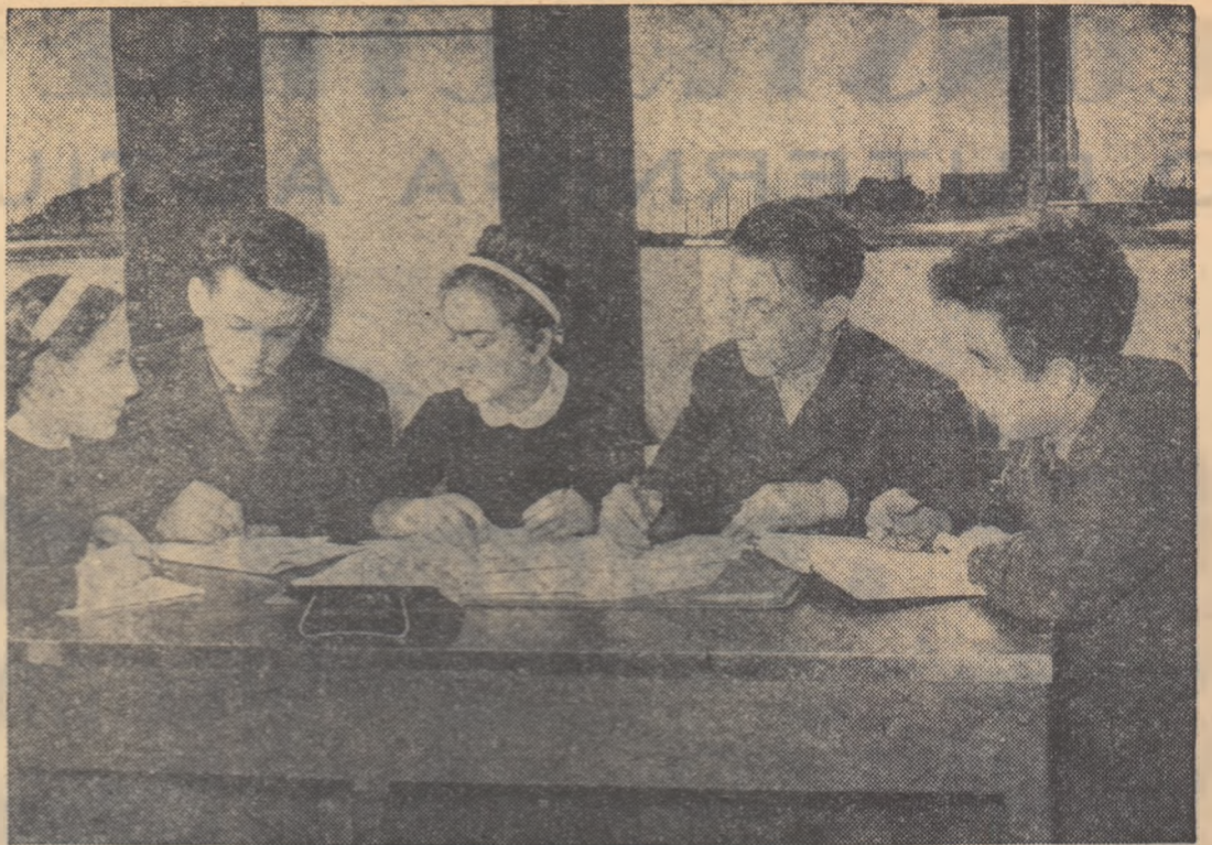
O adunare a activului U.T.M. de la Școala medie „Gh. Șincai” din București.

2. Aprecieri asupra disciplinei și pregătirea clasei pentru ora următoare.