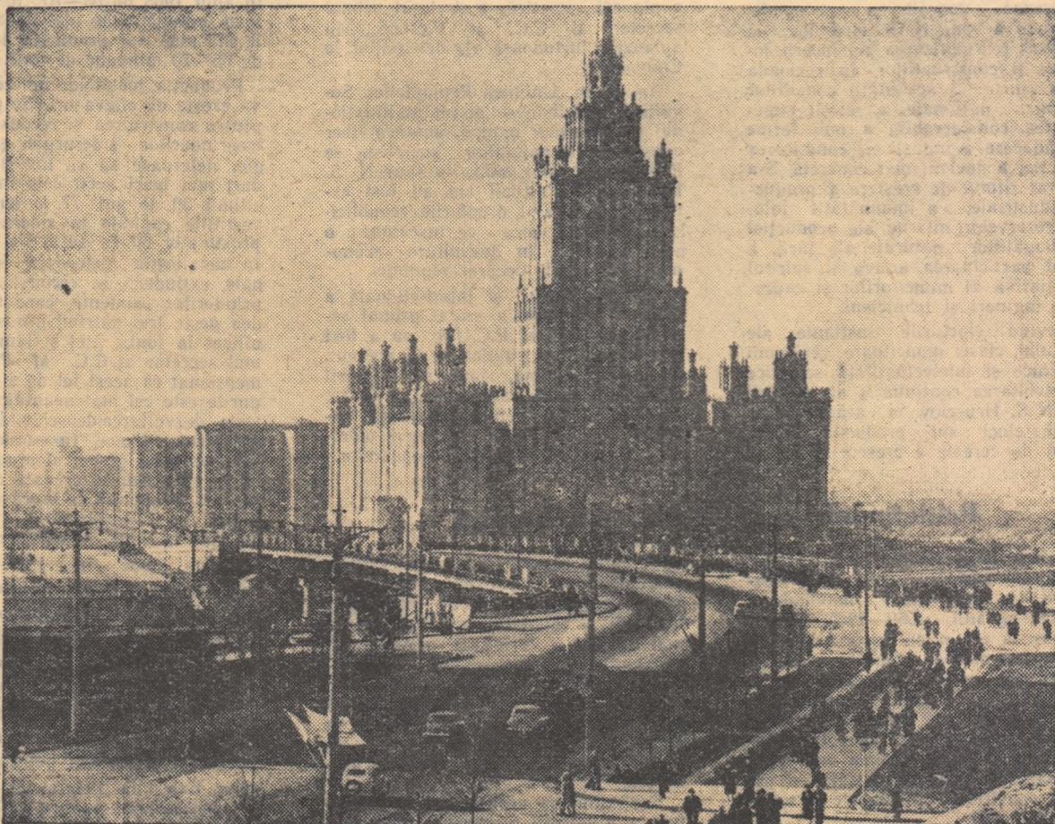
Moscova crește în ritm uimitor. Pretutindeni apar clădiri impunătoare. În clișeu marile construcții de pe bulevardul Kutuzov.