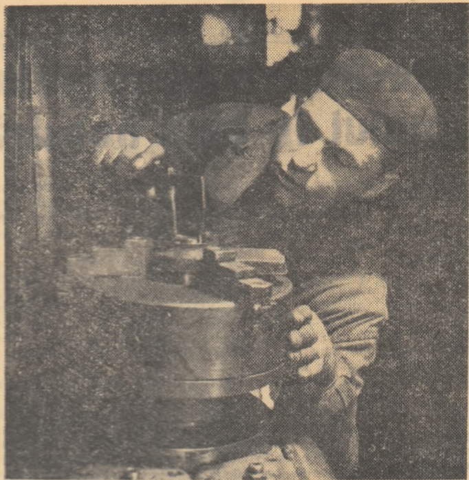
Lucrările de control pentru încheierea trimestrului II sînt pentru acești o serioasă verificare a cunoștințelor și deprinderilor însușite.