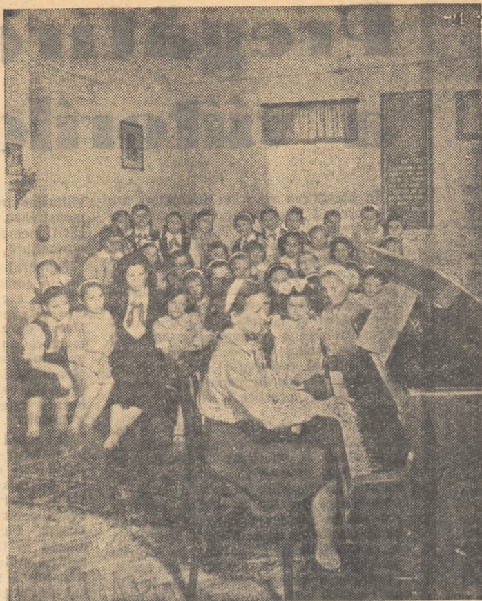
La casa de copii „A. S. Makarenko” din București.