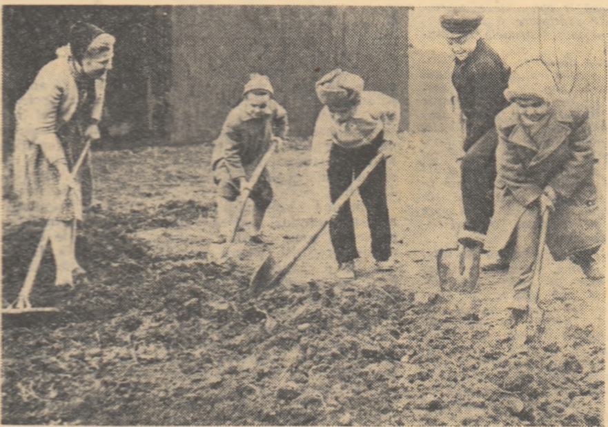
Elevii Școlii de 7 ani nr. 179 din București pregătesc terenul agricol pentru însămînțări.