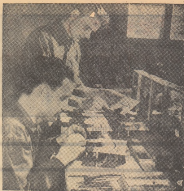
În atelierele întreprinderii de material didactic se confecționează aparate de fizică, mulaje reprezentînd structura cuticulei etc.