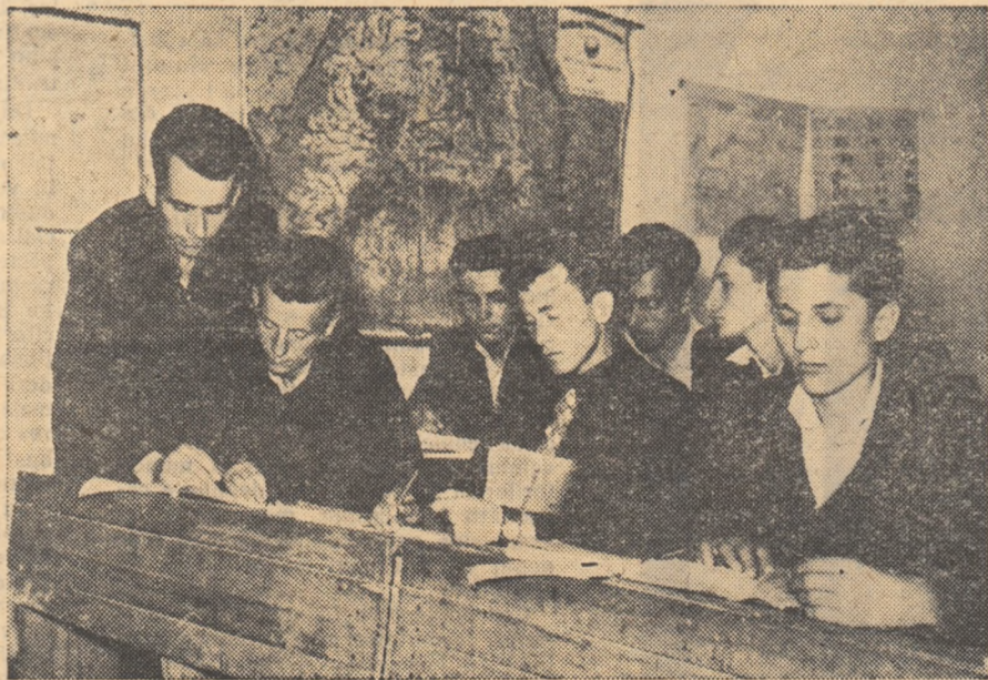
Tineri petroliști din Țicleni, regiunea Craiova se pregătesc pentru admiterea în învățămîntul seral