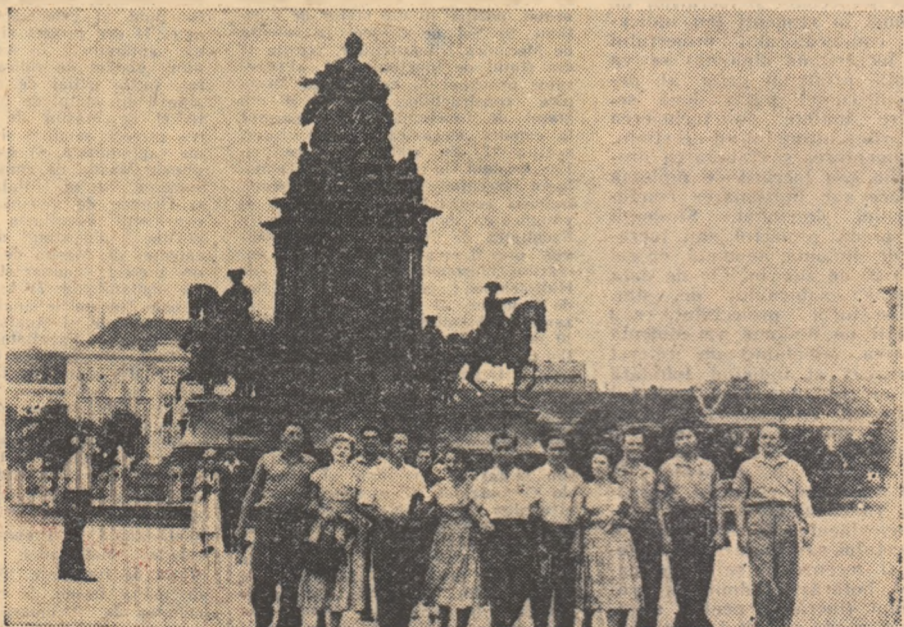
Tineri din delegația noastră au vizitat monumentele Vienei