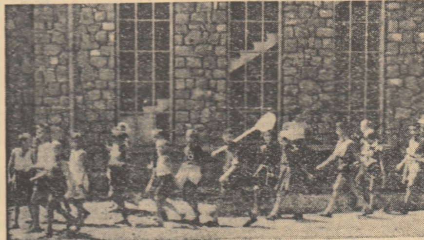
Întoarcerea din excursie

— Ce faci picuile? — Mă odihnesc! Figura plictisită a picuului din tabăra instalată la Preventoriul din Bușteni m-a determinat să continuu: — Și ieri ce-ai făcut? — Ne-am odihnit! — Și mine? — O să ne odihnim... Zice că sîntem „la odihnă”!