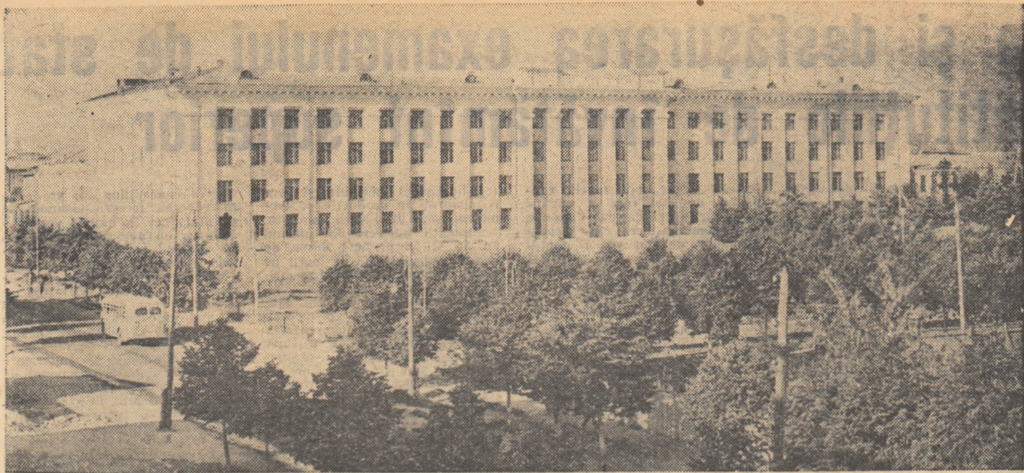
Noua clădire a Institutului pedagogic din Ceboksar