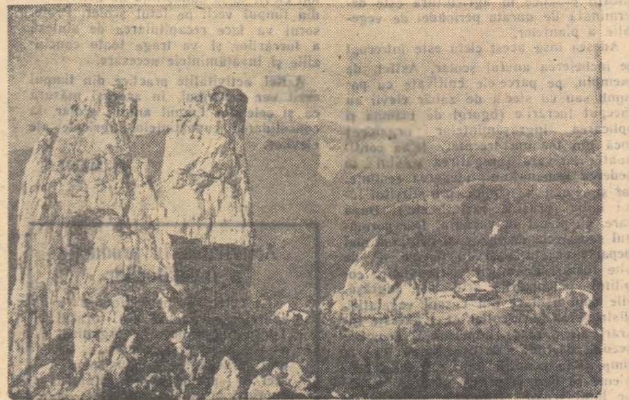
Munții Rarău — Pietrele Doamnei

Textul lecturilor alese trebuie să fie egal de programa analitică, de conținutul lecțiilor. Prezența unor