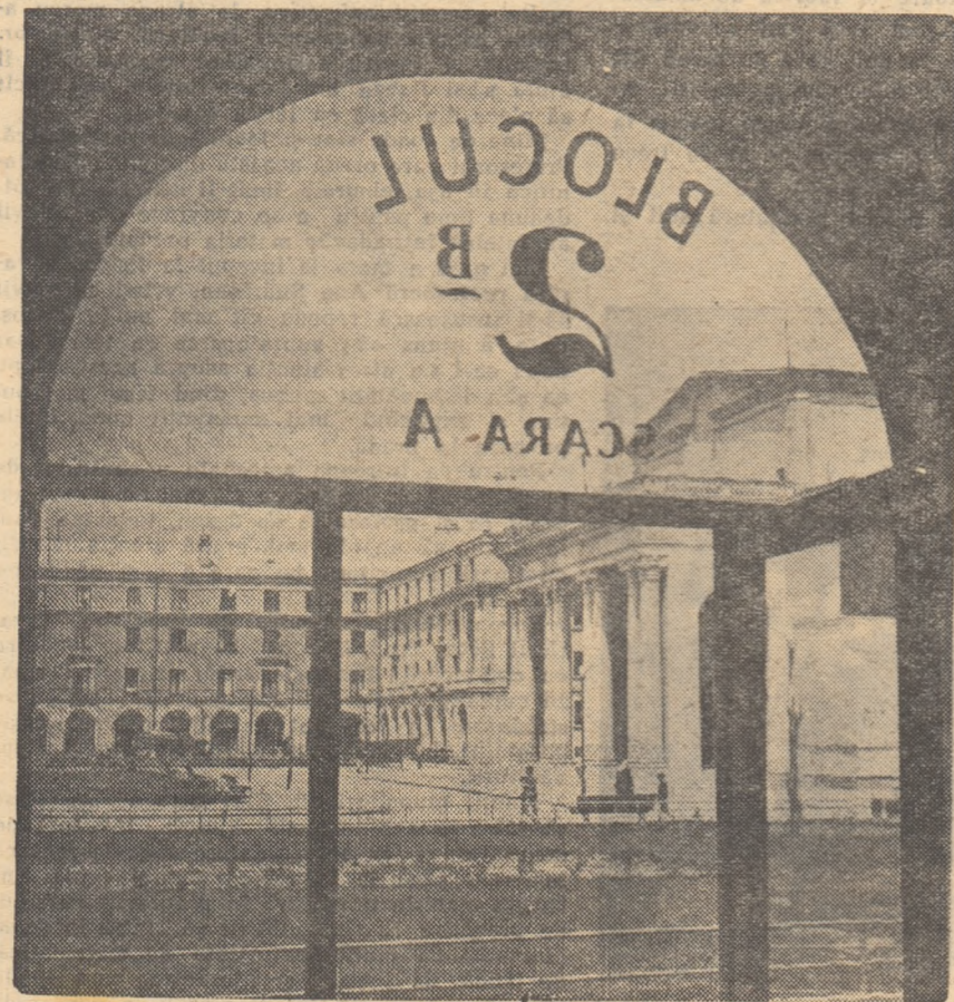
Se ridică necontenit nivelul de trai al oamenilor muncii din patria noastră. În fotografie unul din noile coartale de blocuri muncitorești din Bucureștii Noi.

PARTICIPANȚII LA PLENARA C.C.S. AU ARĂTAT CA REALIZA-