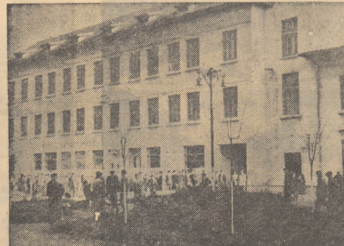
Clădirea Centrului școlar agricol din Buzău