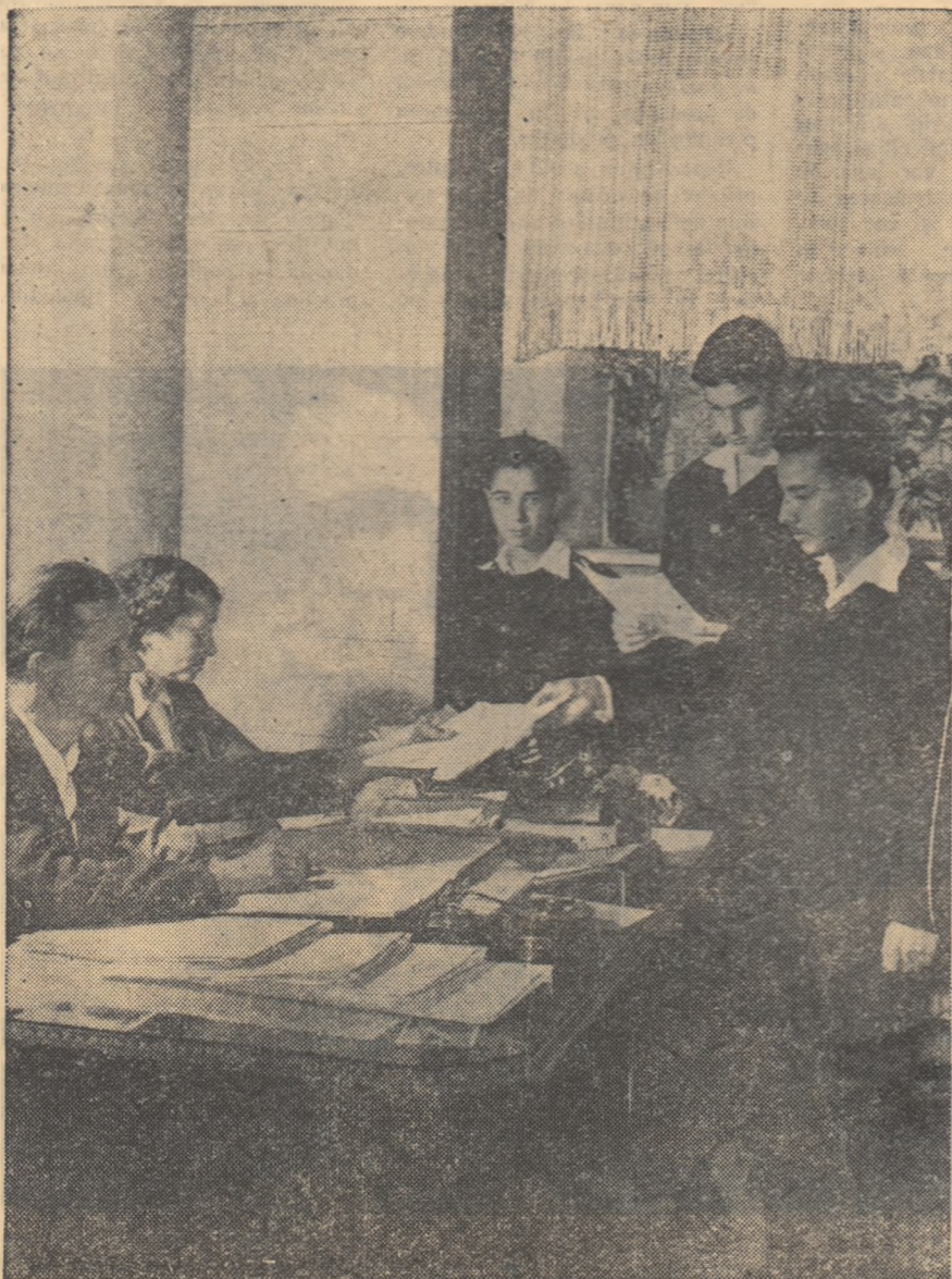
Înscrierile pentru noul an la Școala medie „Nicolae Bălcescu” din Capitală.

Să fie oare vorba aici de „cauze colective”? Se pare mai curînd că