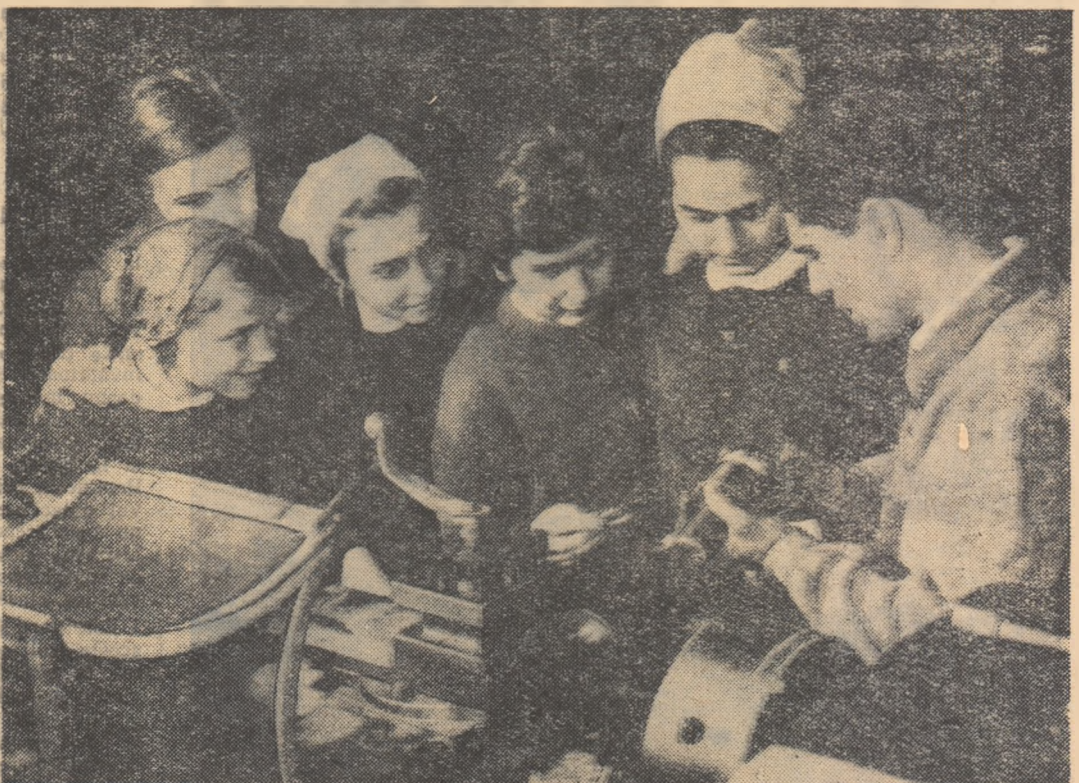
În cadrul lucrărilor practice efectuate la Atelierele C.F.R. „Grivița Roșie”, elevii Școlii medii nr. 4 „Aurel Vlaicu” au studiat construcția strungului

5. La încheierea fiecărui trimestru se va analiza munca depusă de elevi. Aceștia vor fi notați — ca la orice altă disciplină — conform cunoștințelor practice și teoretice dobîndite.