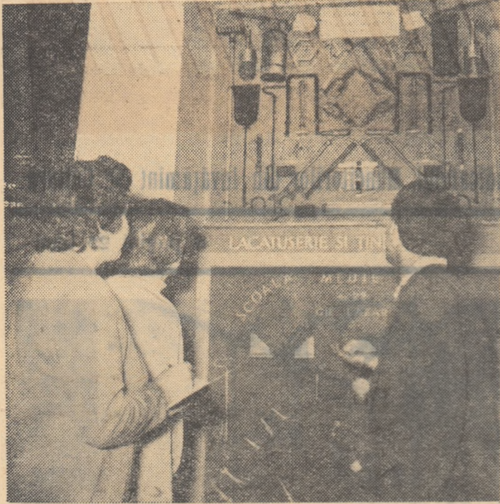
Vizitatorii privesc cu interes exponatele care oglindesc legarea învățămîntului de practică

DE LA MINISTERUL INVĂȚĂMÎNTULUI ȘI CULTURII