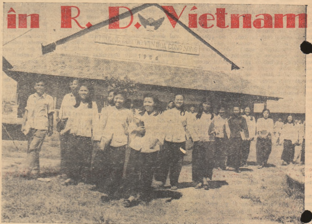
Elevii unei școli de perfecționare a culturii generale.

Acum, la 14 ani de la proclamarea Republicii Democratice Vietnam, poporul vietnamez se mîndrește cu mari realizări în toate domeniile. Anul școlar care s-a încheiat a fost primul an de luptă pentru realizarea învățămîntului socialist. Este greu, desigur, să treci în revistă toate rezultatele atât de variate înregistrate în decursul acestui an de eforturi, de luptă împotriva numeroaselor greutăți pe care le prezintă o muncă nouă. Totuși, pentru a le constata, ajunge să-ți arunci privirea asupra aspectului unei școli, să răsfoiești caietele unui elev, să vizitezi atelierele de producție sau orezăriile cultivate de elevi. Toate acestea sînt realizări noi, create conform principiului imbinării muncii școlare cu munca productivă. Dar rezultatul cel mai convingător îl constituie elevii înșiși care, în marea lor majoritate, au încheiat anul școlar cu mari succese. Fiecare din cei 1.117.569 de elevi ai Vietnamului de Nord, fie că este în clasa a III-a, în clasa a V-a sau în clasa a X-a, poate să ilustreze rezultatele primului an de învățămînt socialist.