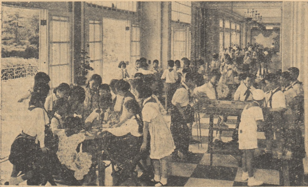
În orașele Chinei s-au ridicat palate și case ale pionierilor. După orele de școală elevii vin să participe la jocurile științifice și tehnice organizate aici. În fotografie: un colț al Palatului tineretului din Șanha.

Multe comune populare, uzine, fabrici și mine au înființat diferite tipuri de școli serale pentru oamenii muncii din producție. Prin aplicarea liniei Partidului Comunist de îmbinare a învățămîntului cu munca productivă, aceste școli au ajuns la realizări remarcabile.