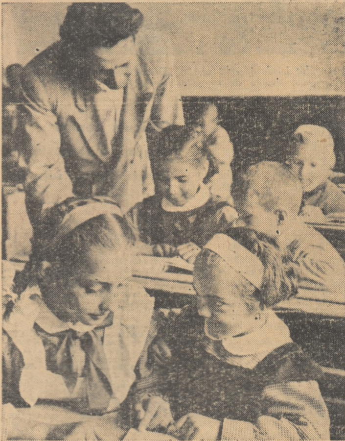
Elevii clasei a V-a de la școala de 7 ani din satul Călugăreni, raionul Vidra, au venit în vizită la cei mai mici colegi ai lor, elevii clasei I-a.