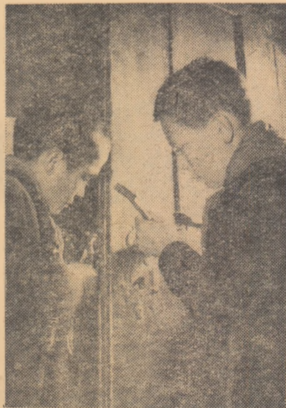
Elevii interni de la Școala elementară din comuna Prejmer, regiunea Stalin, poartă multă grijă internatului lor. Iată-l în timpul liber reparînd o ușă.