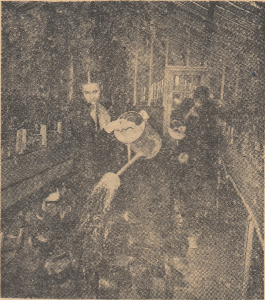
În sera Școlii medii nr. 151 din Moscova se desfășoară interesante lucrări practice de biologie.