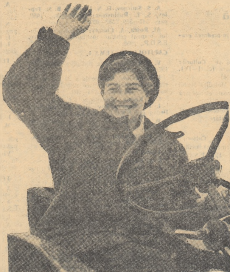
O dată cu venirea primăverii au pornit lucrul pe întinsele ogoare ale Uniunii Sovietice, alături de tractoriști, și elevii școlilor profesionale de mecanizatori