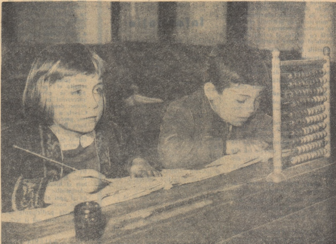
Nici o lecție de aritmetică nu e grea pentru școlarii clasei I-a din comuna Popeni, raionul Birlad