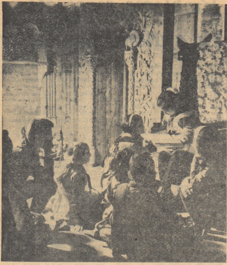
În camera de povești a Palatului pionierilor din Capitală.

De îndată ce au aflat tema consfățuirilor din acest an — educarea prin muncă a preșcolărilor — educatoarele din orașul Arad, ca și cele din restul satelor și orașelor patriei, au început să desfășoare o mai bogată activitate în direcția formării deprinderilor practice de muncă la copii, să se pregătească mai bine în vederea consfățuirilor. Fiecare dorește să se prezinte la consfățuirile cu un material concret cât mai bogat și cât mai variat.