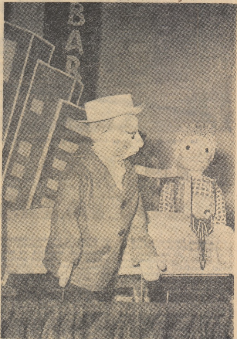
Scenă din spectacolul „Călătoria lui Trombi pe pămînt” prezentat de Teatrul de păpuși din Magdeburg (R.D.G.)