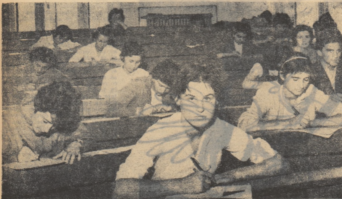
Primul pas către cariera de profesor: examenul de admitere în facultate