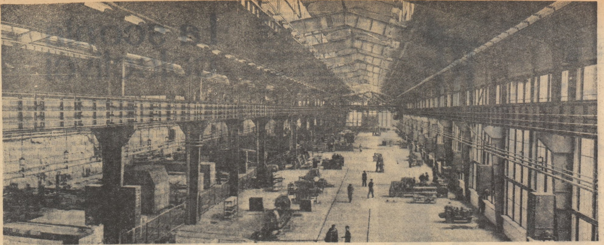
Noua hală de motoare Diesel electrice a Combinatului metalurgic din Reșița