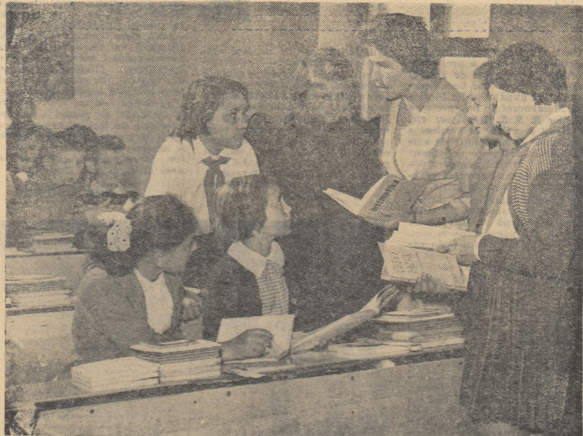
La școala de 9 ani de la Libeuzice, lângă Praga, înainte de prima lecție din acest an.