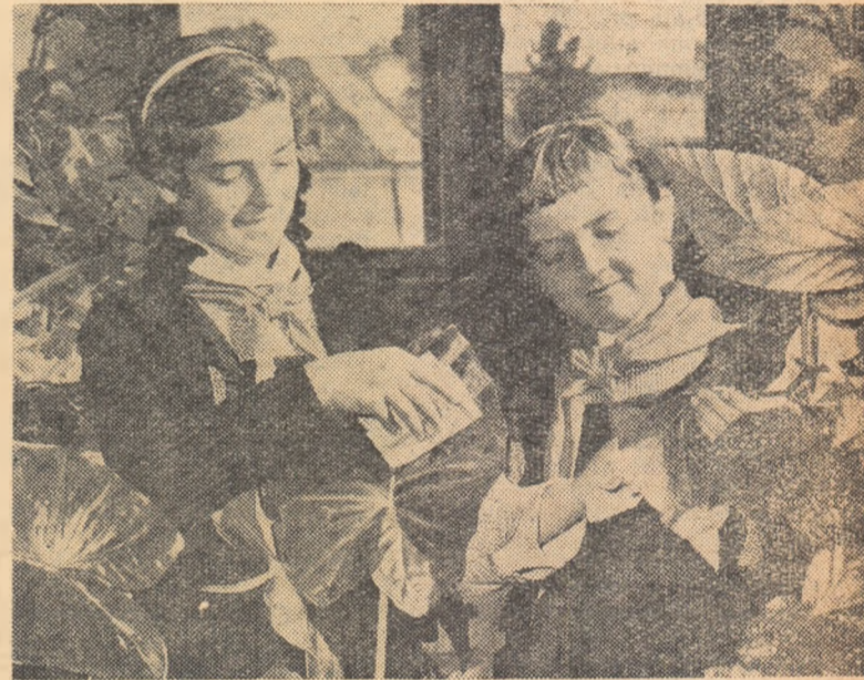
Îngrijirea colțului științelor naturii este unul din obiectivele muncii rîndnice de autodeservire desfășurată de elevii Școlii elementare nr. 3 din Pitești.

La rîndul lor și cadrele didactice de la școlile din orașul Botoșani se preocupă cu grijă de educarea elevilor în spiritul economisirii. Ca rezultat al acestei activități, majoritatea școlilor din cîmpul orașului se găsesc la sfîrșitul lunii octombrie a.c. printre unitățile fruntașe din raion în acțiunea de economisire.