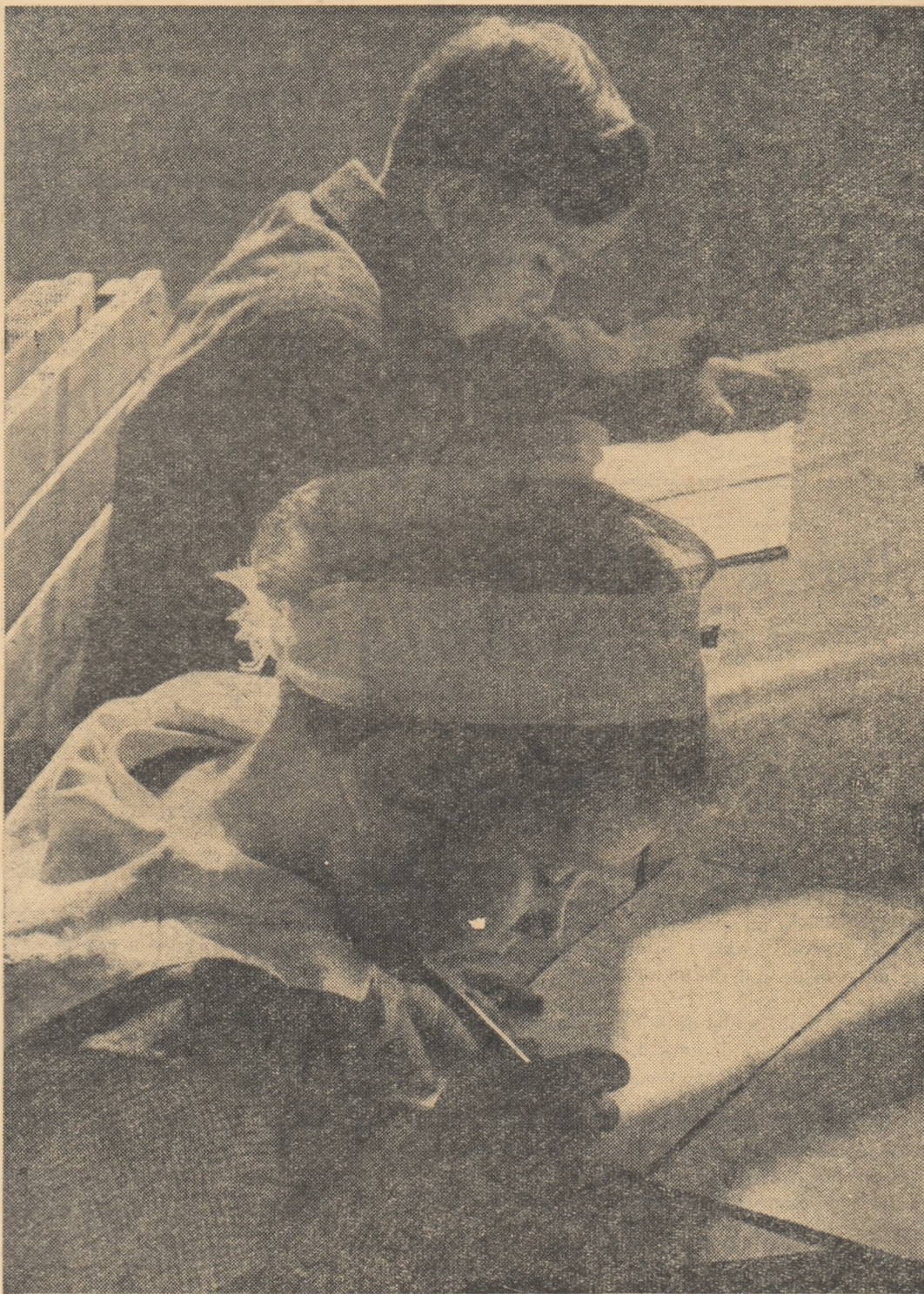
Minunile taine ale alfabetului