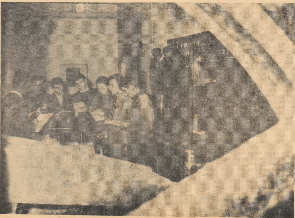
În cabinetul de centrale și stații elevii ascultă atenți explicațiile profesorului de specialitate privind efectuarea unei noi aplicații practice