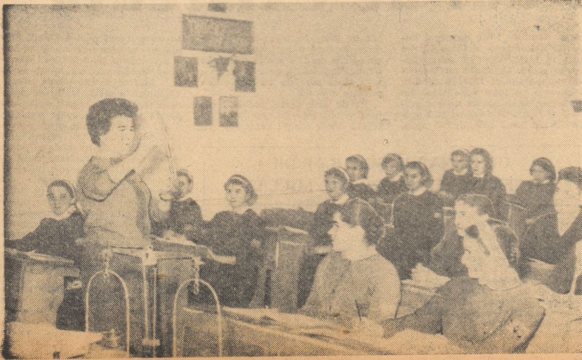
Marele din Suceava

Alte relații se obțin de la secretariatele facultăților.