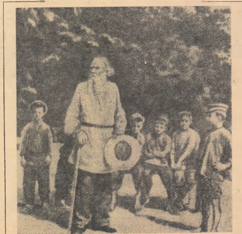
Tolstoi cu o grupă de copii de țărani din Iasnaia Poliana în anul 1908.

Comemorarea a 50 de ani de la moartea lui Lev Tolstoi este de aceea închinată nu numai unui titan al creației literare, ci și pedagogului care, în tot cursul vieții lui, s-a preocupat de soarta celor tineri, s-a apropiat cu înțelegeră de ei și a căutat să le făurească o viață mai luminoasă.