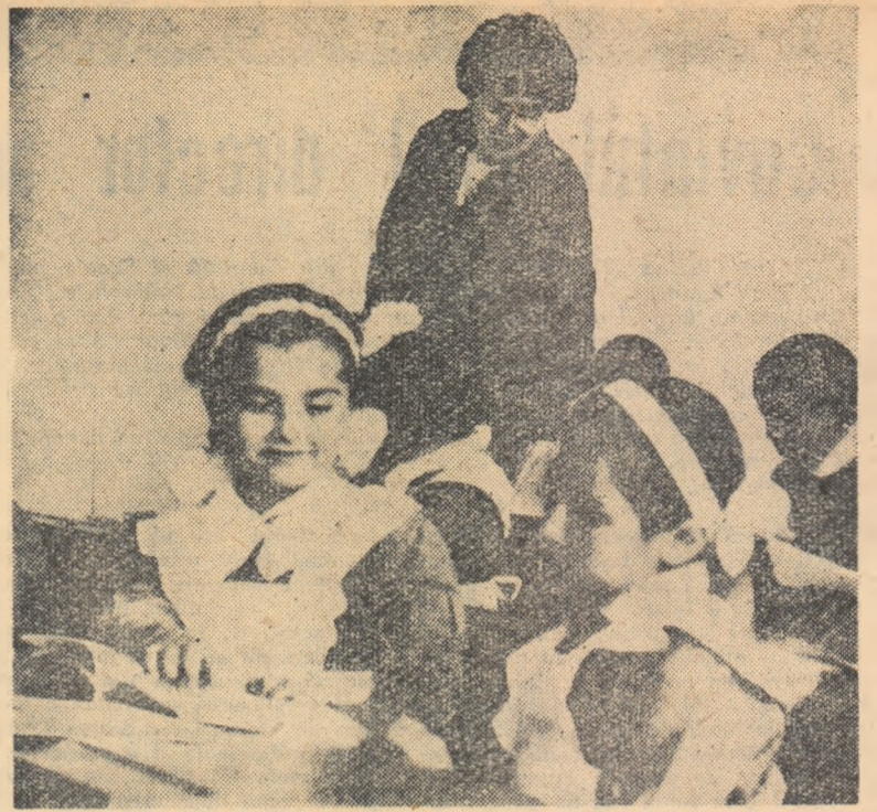
Munca elevilor Școlii medii nr. 36 din București pentru însușirea cunoștințelor, este călăuzită de către învățătorii și profesorii pas cu pas, cu dragoste și atenție.