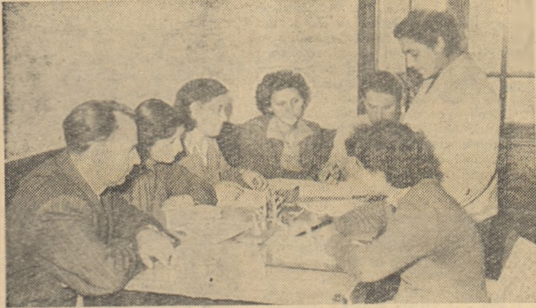
Comisia metodică pentru clasele I-IV ale Școlii din comuna Gheorghe Doja, raionul Slobozia, poartă rodnice discuții în legătură cu aplicarea noilor programe școlare.

directoarea Școlii de 7 ani nr. 1, Pitești