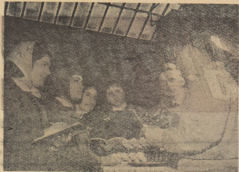
Elevii Școlii medii nr. 38 din Capitală învață să execute interesante lucrări complexe în timpul practicii în producție la Intreprinderea „Electroaparataji”.