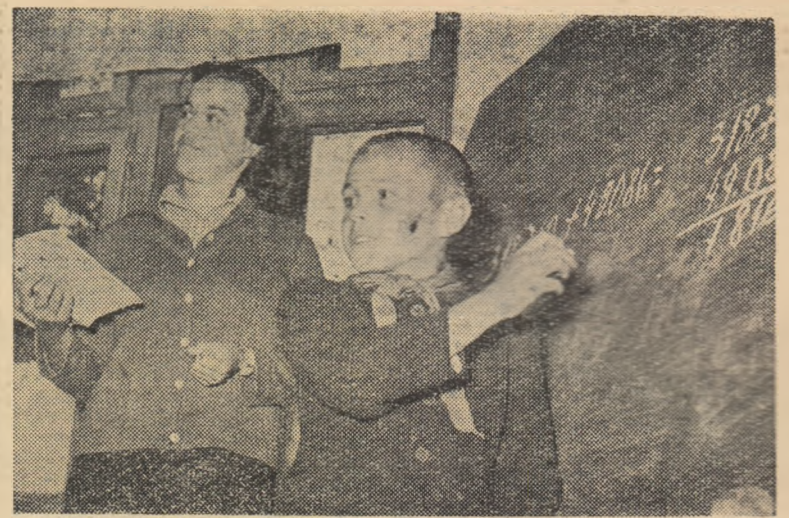
Formarea deprinderilor de calcul matematic constituie una din principalele preocupări ale profesorilor din școlile de cultură generală.