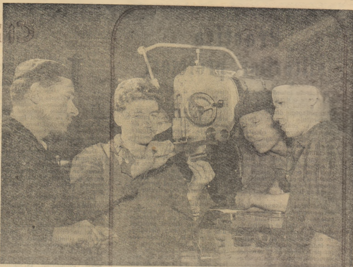
In timpul practicii în uzină, ucenicii școlilor profesionale au posibilitatea de a cunoaște funcționarea celor mai moderne mașini-unelte.

Grupul școlar al uzinelor „UNIO” din Satu Mare