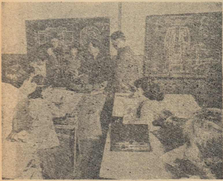
Înainte de începerea unei noi lucrări practice de desen, profesorul face un scurt instructaj prealabil grupei de elevi care urmează să o execute

Se întâmplă uneori ca profesorul de desen să fie nemulțumit de rezultatul unei lecții, deși atât expunerea noilor cunoștințe cât și demonstrația au respectat toate cerințele științifice și metodice.