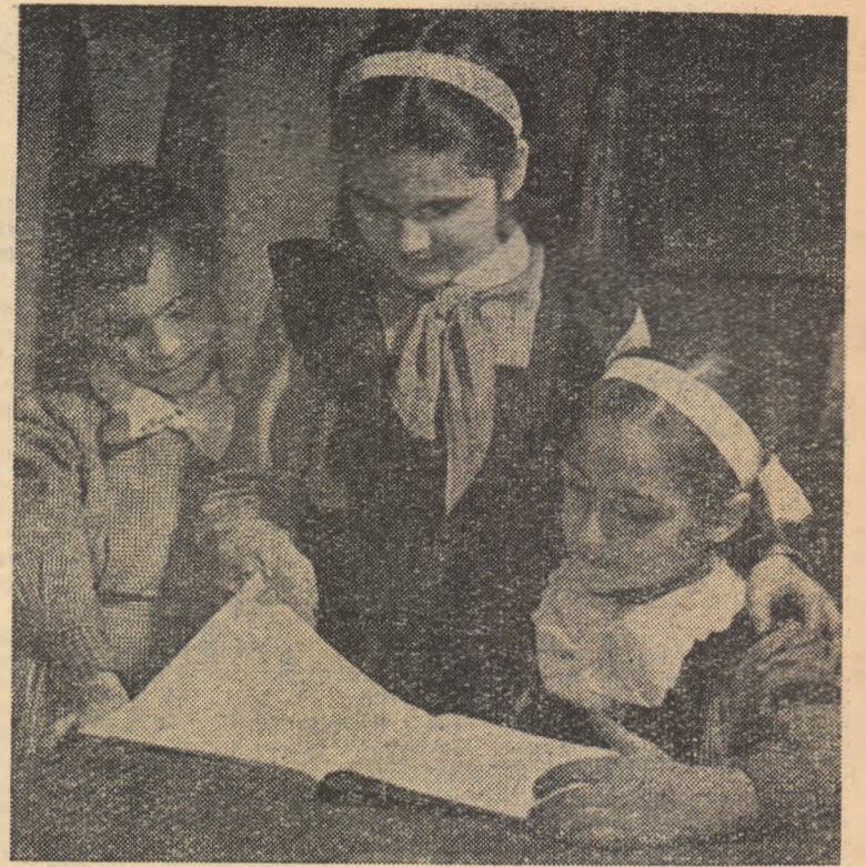
„Citiți și voi cartea aceasta. Mie mi-a plăcut foarte mult” — le spune o pionieră din clasa a treia colegilor săi mai mici dintr-a doua

sînt destul de greu de citit, de observat, deoarece particularitățile lor nu sînt suficient evidențiate. „M-am convins și mai mult de acest lucru — scrie tov. V. Bucur — cînd am observat că un elev de-al meu aduce zilnic și abecedarul fratelui său din anul trecut, pentru a citi de aici textele care nu se schimbaseră. Pe acest abecedar, unde literele sînt scrise cu negru, ele pot fi citite mai bine”.