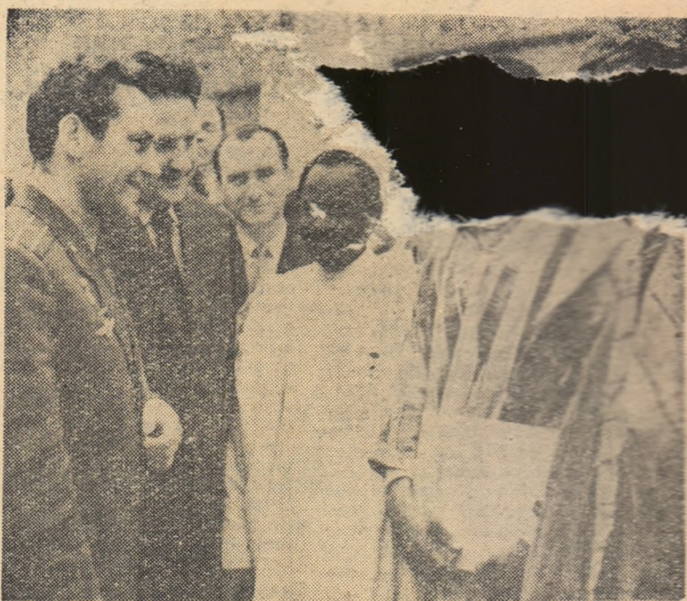
Cosmonautul numărul 2, Gherman Titov, în mijlocul unui grup de delegați la Congresul Mondial Sindical