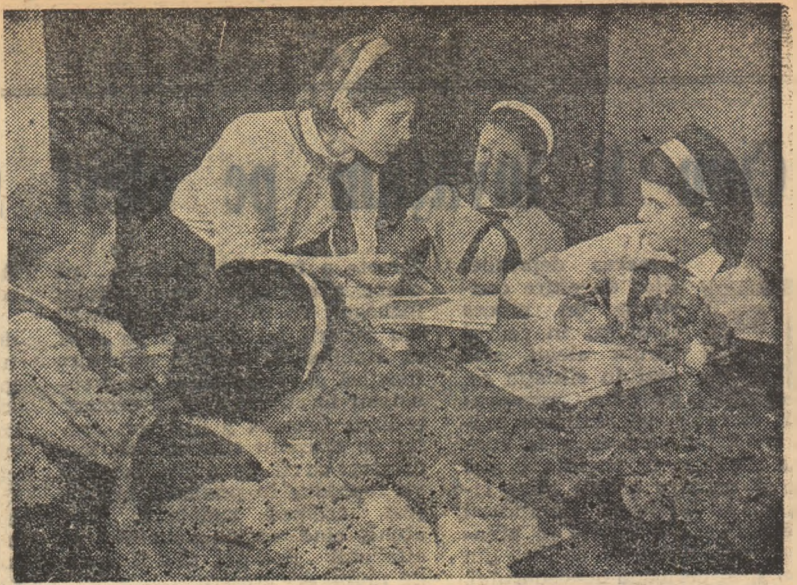
Candaceza amălii de pionieri dezbate două importante probleme: rezultatele primului trimestru și pregătirea pentru desfășurarea vacanței de iarnă

În cele 12 case ale pionierilor din regiune se vor organiza serbări ale pomului de iarnă și seri de carnaval. Pe lângă cluburile muncitorești și bazele sportive vor fi deschise cluburi ale elevilor, unde se vor organiza concursuri de șah, de tenis de masă etc.