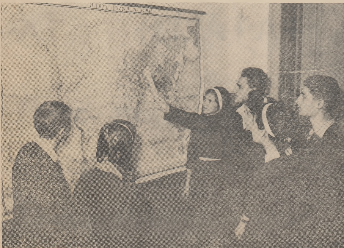
In fața hărții lumii elevii școlii medii „Mihail Eminescu” comentează cu însuflețire ultimele evenimente prezentate în cadrul informărilor politice săptămânale