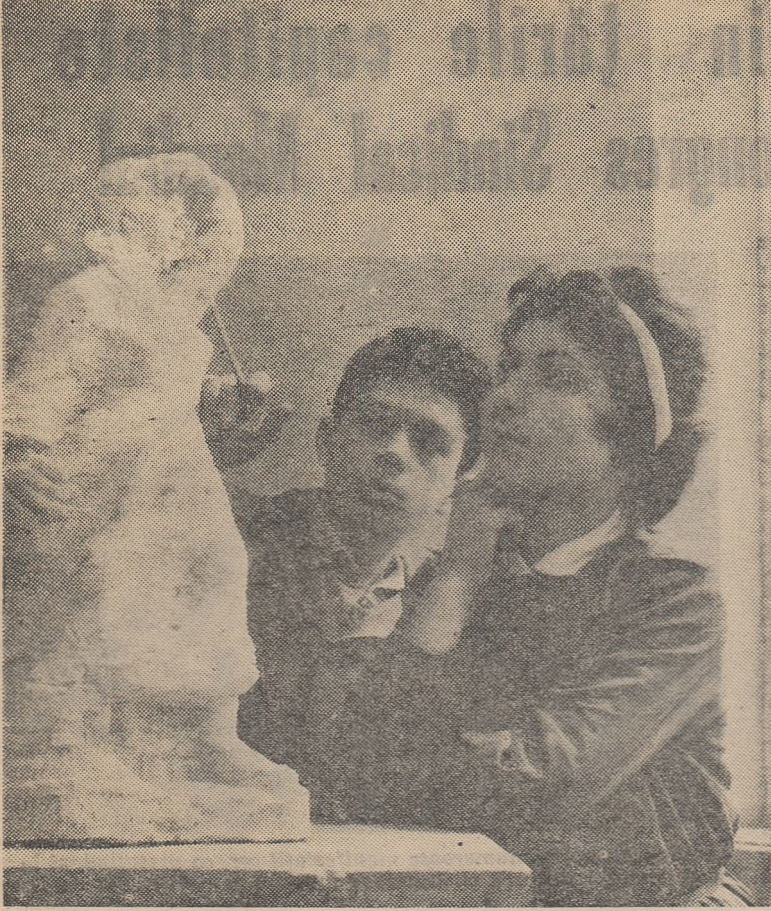
Vitii artiști, elevii Școlii medii de arte plastice din Capitală discută cu mult simț critic propriile lor lucrări.