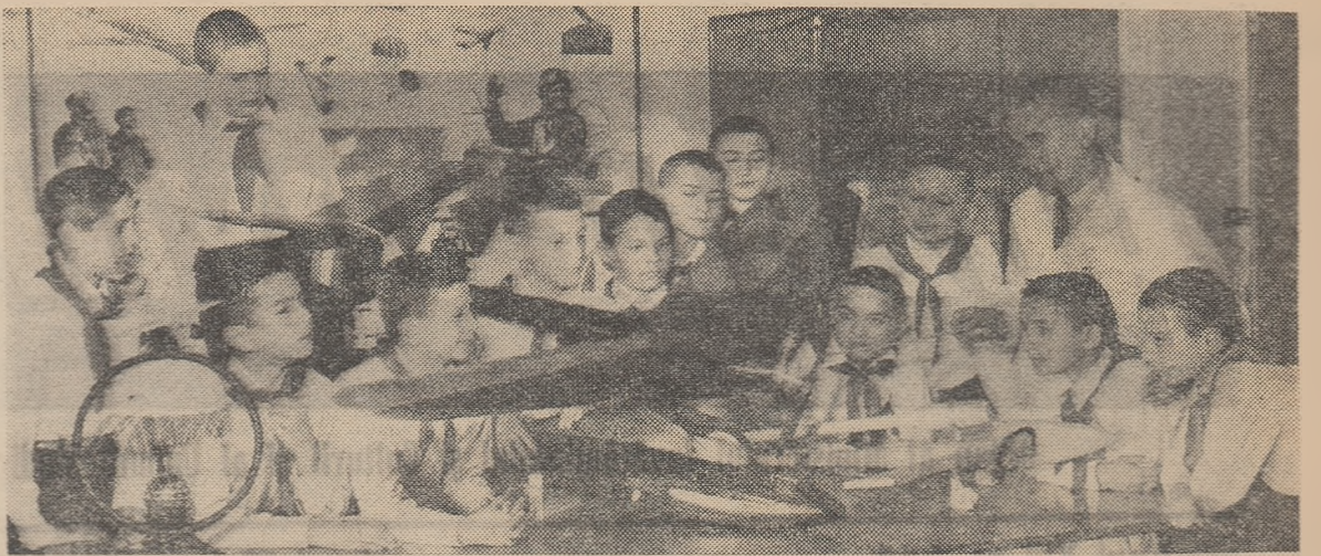
Zeci de modele de cele mai diverse tipuri stau la dispoziția viitorilor cuceritori ai văzduhului, care-și fac inițierea în cercul de aeromodelism al Palatului pionierilor din Capitală.