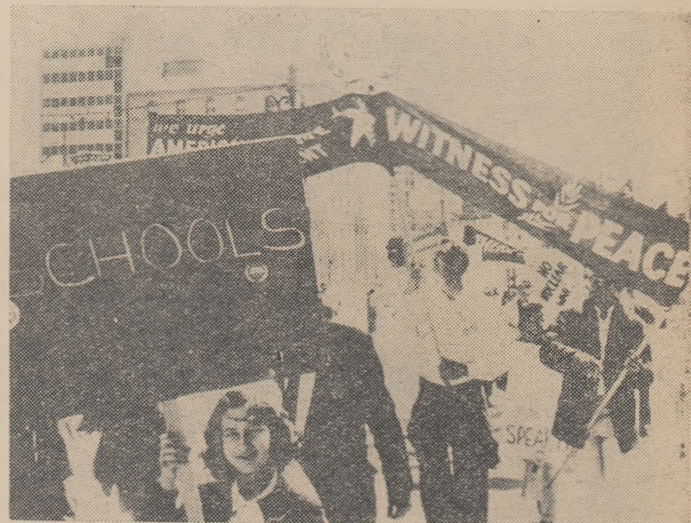
La San Francisco numeroase manifestații cer, ca pretutindeni în țările capitaliste, reducerea cheltuielilor militare și construcția de noi școli.

Așa se explică de ce unele guverne, nu numai că refuză să mărească fondurile bugetare destinate învățămîntului public, dar reușesc chiar să le diminueze, împărțindu-le cu învățămîntul particular. În Chile de exemplu, în ciuda faptului că lipsesc școli pentru cca. 400.000 de copii, mai mult de 13 la sută din bugetul învățămîntului public a fost atribuit sub formă de subvenții învățămîntului particu-