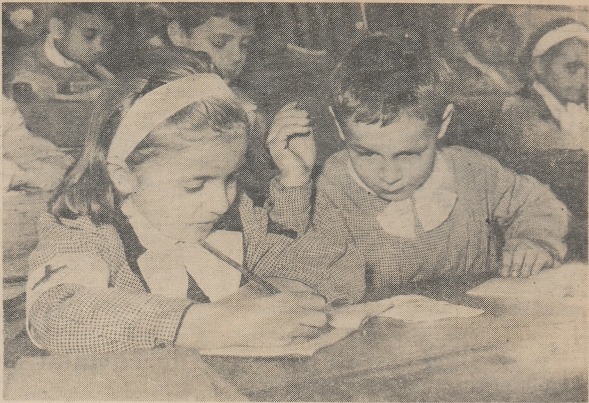
Cum reușește colega mea să scrie atît de frumos?

Programul recentului concert al elevilor de la Școala medie nr. 3 din Sibiu ilustrează preocuparea profesorilor de a dezvolta la copii dragostea pentru muzică, pentru frumos. O preocupare laudabilă.