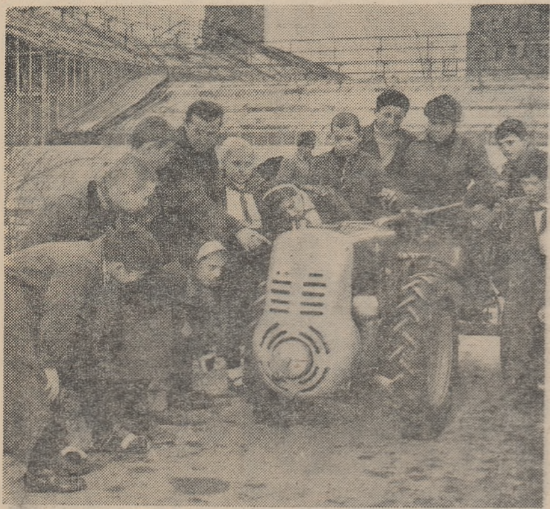
Activitatea Cercului de mecanică și mașini agricole de la Palatul pionierilor din Capitală este foarte interesantă. Iată-i pe membrii cercului urmărind cu atenție explicațiile maestrului despre modul de funcționare a pompei de stropit.