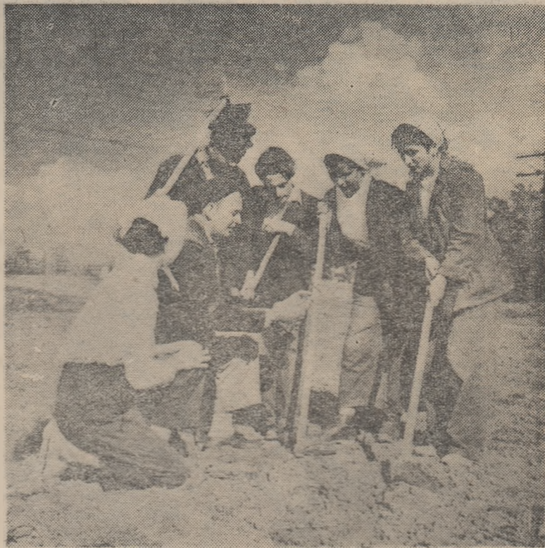
Elevi ai Centrului școlar agricol nr. 1 din Turda la practică în Stațiunea experimentală pentru cultura porumbului din Șimnic, regiunea Ollenia.