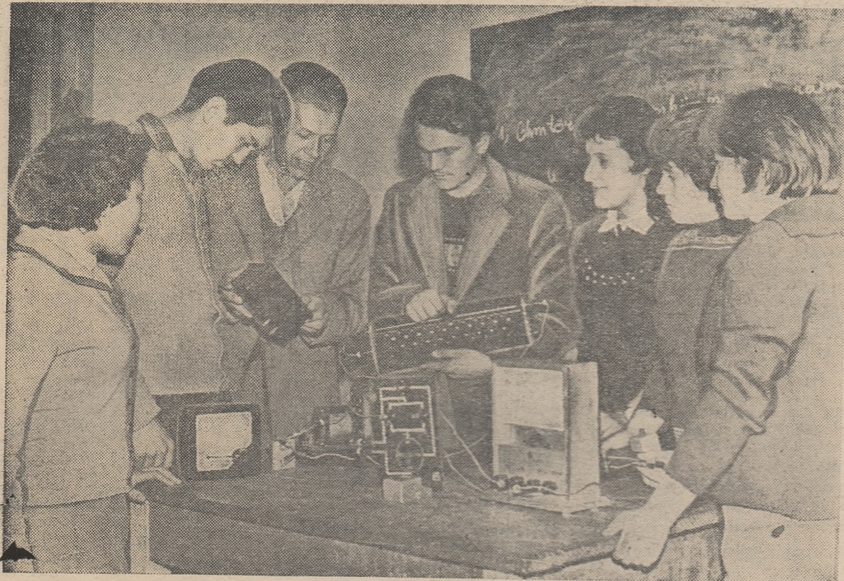
La ora de fizică, în laboratorul școlii medii serale din St. Gheorghe.