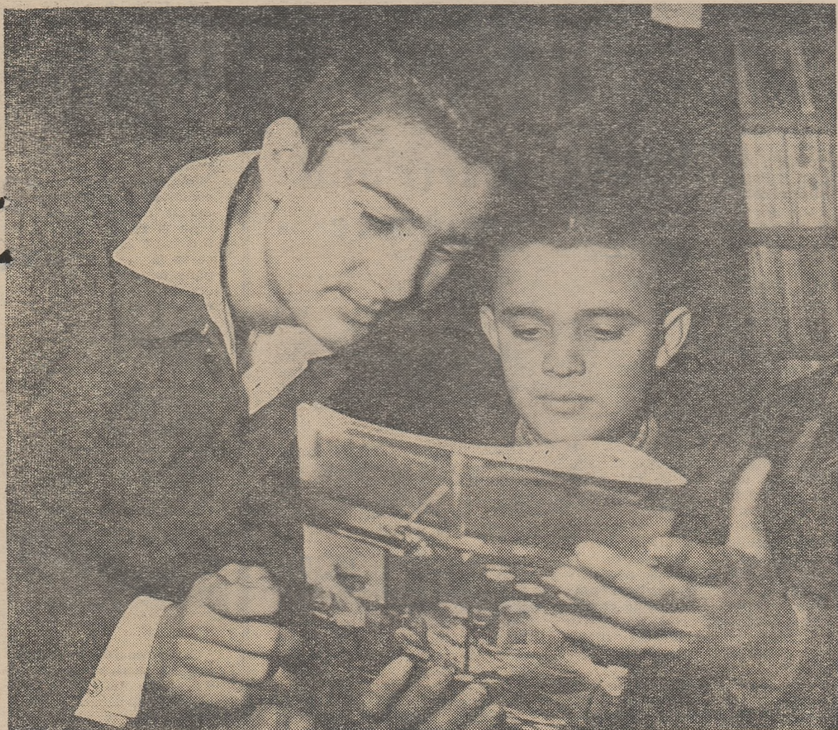
În biblioteca tehnică a Școlii profesionale „23 August” din București elevii găsesc întotdeauna interesante noutăți științifice.