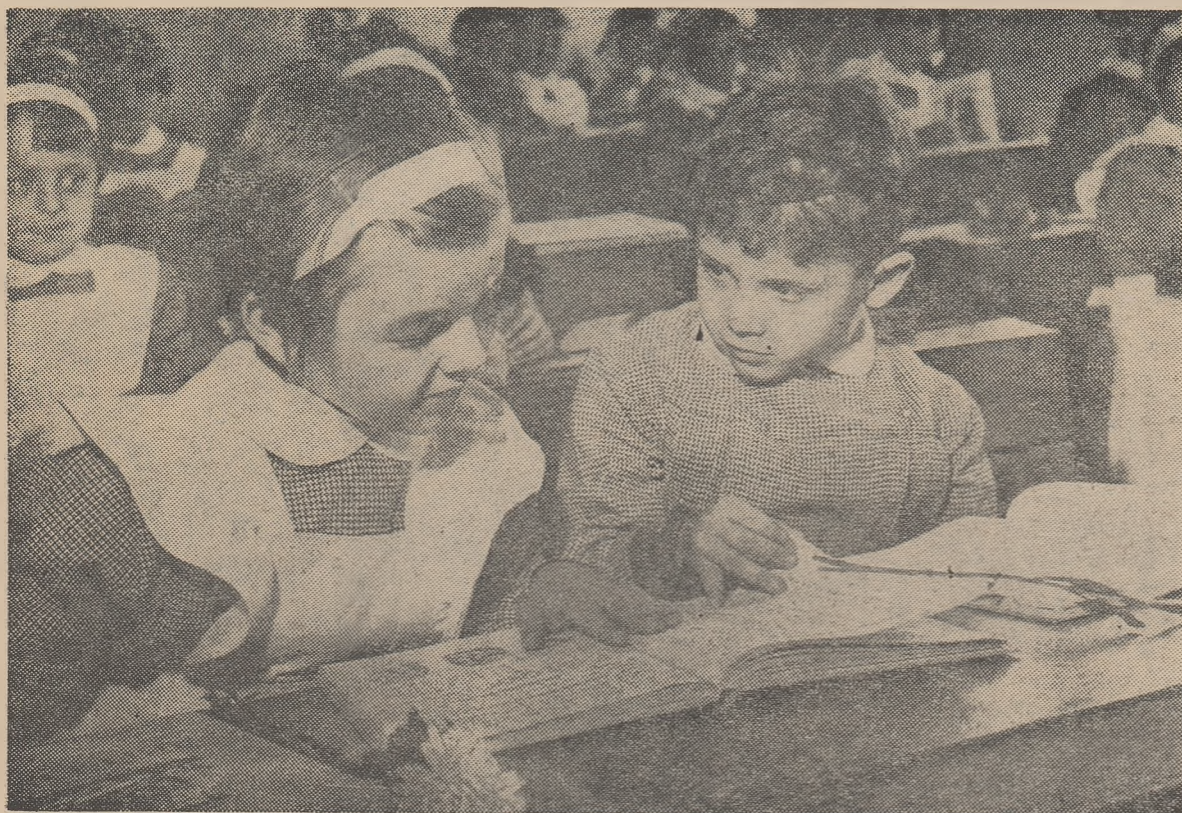
Colegi de bancă