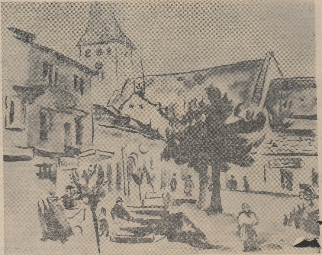
E. BRATEȘ : „Peisaj”