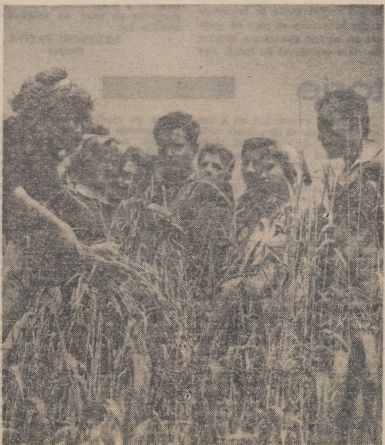
Elevi ai școlii din Valea Călugărească ascultînd explicațiile profesorului asupra dezvoltării culturii de secară.