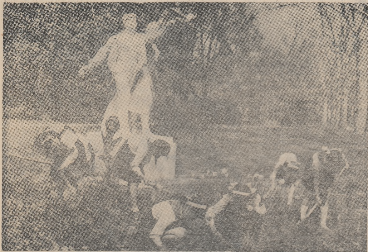
In parcul Palatului pionierilor din București.