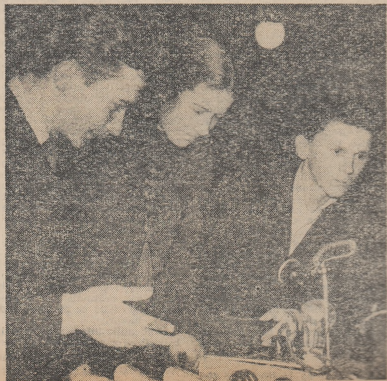
Materialele didactice executate de elevii Scolii medii nr. 1 din S...