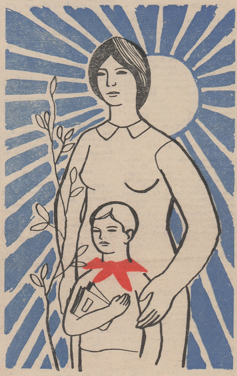
Desen de GH. BOȚAN

Cu prilejul „Zilei învățătorului”, felicităm călduros cadrele didactice ale patriei noastre pentru succesele obținute în muncă, urîndu-le ca în noul an școlar să dobindească succese și mai mari în nobila lor misiune de a educa în spirit comunist tinerele generații.