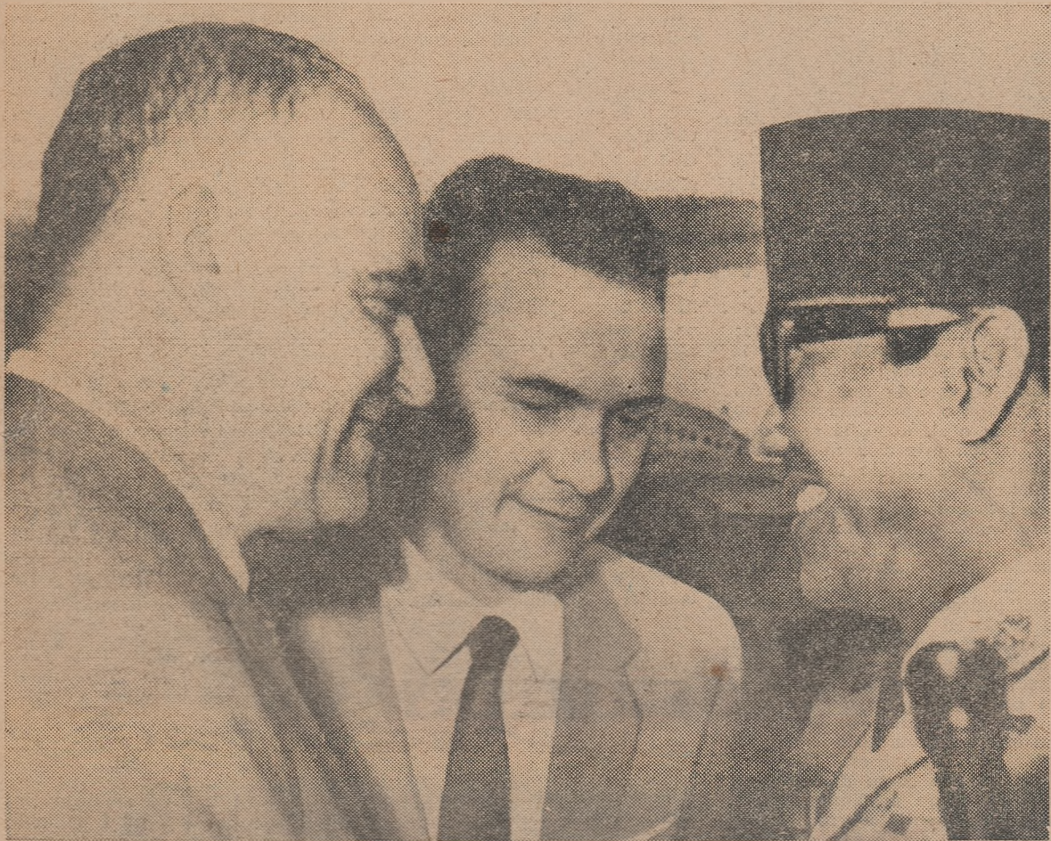
Tovarășul Gheorghe Gheorghiu-Dej întîlnindu-se cu președintele Indoneziei, Dr. Sukarno.