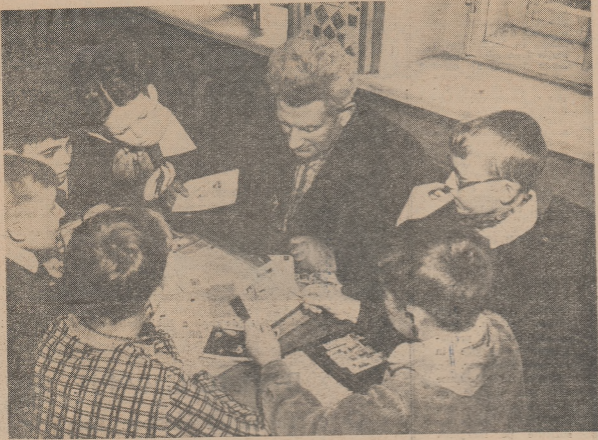
Scrisori de la prieteni de departe. Membrii cercului de pionieri „Amalia Kreisberg” din orașul Nova (R.S.S. Estonă) au primit corespondența