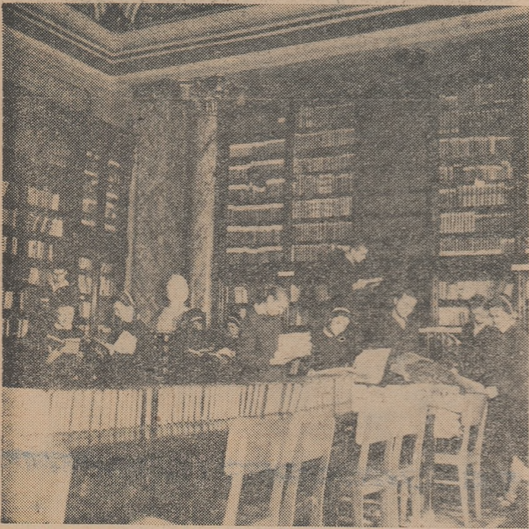
In biblioteca școlii medii „N. Bălcescu” din Craiova