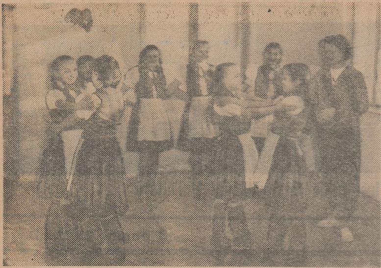
Ciardaș la Casa Pionierilor din Miercurea Ciuc