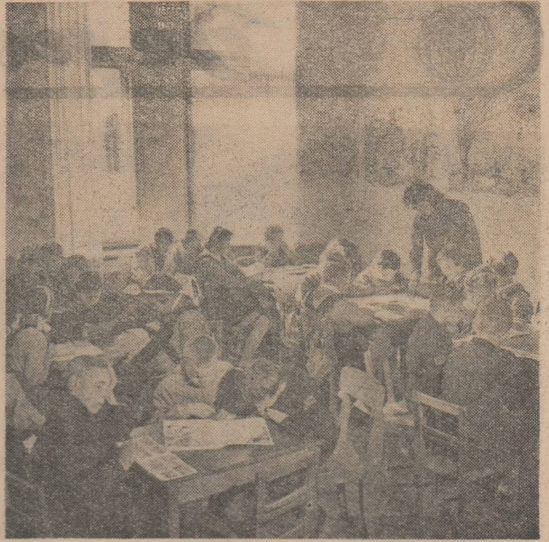
Tineri cititori ai secției de copii a Bibliotecii centrale orașenești din Sibiu