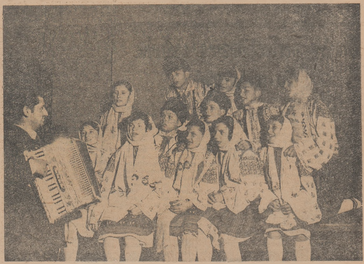
Moment muzical cu echipa de dansuri a școlii medii din comuna Pechea, regiunea Galați