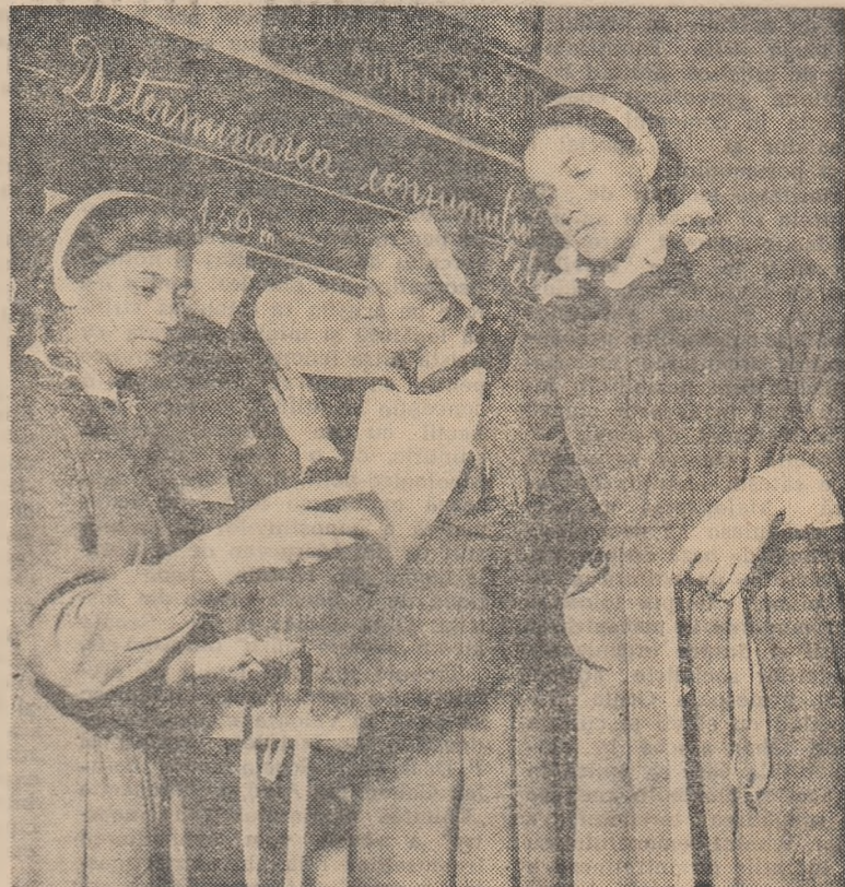
Determinarea consumului specific de material folosit la confecții este o preocupare de frunte a elevilor Școlii profesionale de ucenici F.R.B.

Arh. J. FĂINARU directorul Școlii tehnice de arhitectură din București