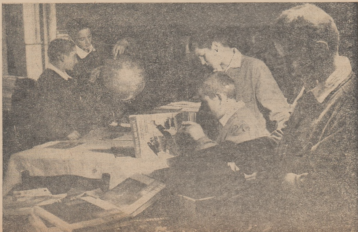
În bibliotecă, elevii Școlii profesionale de mecanizatori agricoli din Botoșani, găsesc publicații din cele