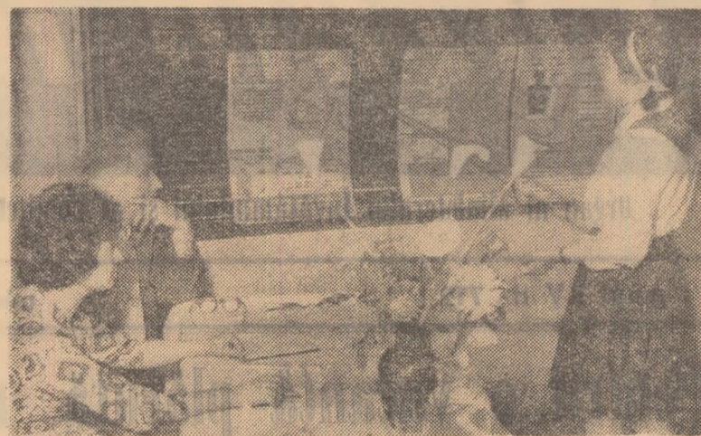
Examenele la geografie în clasa a VII-a de la Școala medie nr. 34 din Capitală