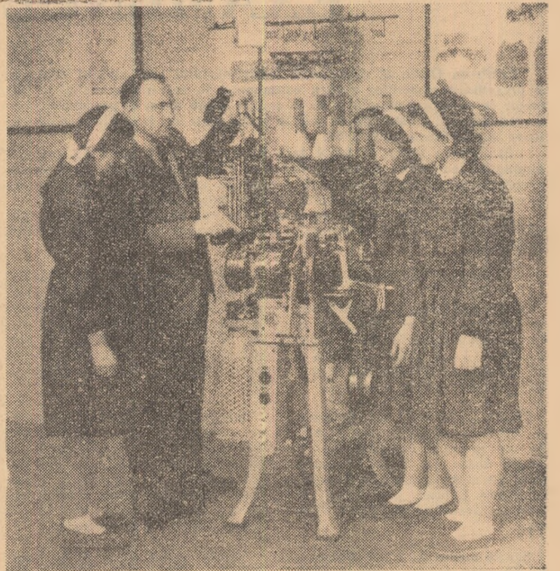
În timpul unei ore de practică la F.R.B. București elevii primesc explicații asupra mașinii circu lare de ciorapi cu doi cilindri