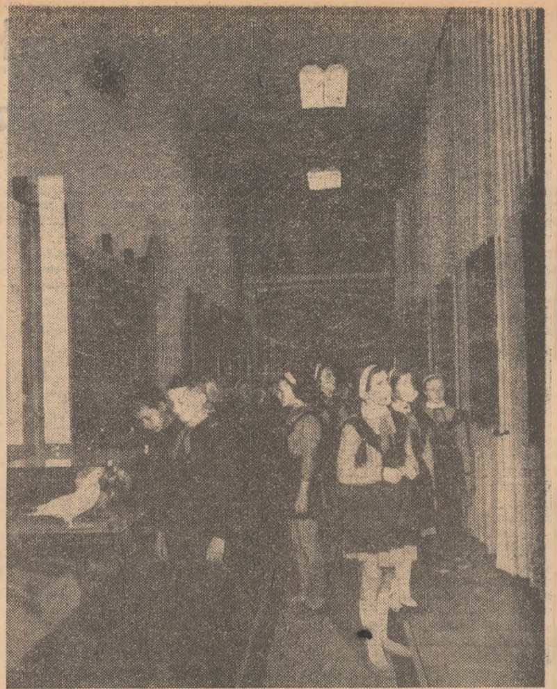
Un grup de elevi de la Școala medie nr. 3 din Craiova în vizită la expoziția de științe naturale din cadrul Muzeului regional Oltenia