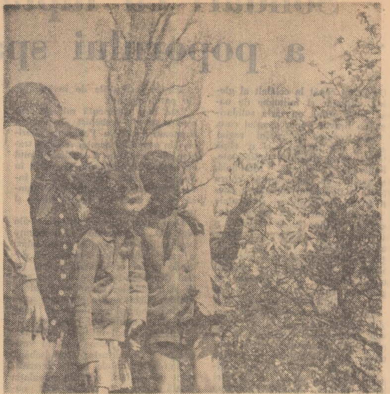
O dată cu sosirea vacanței, cei mai mici școlari au pornit să admire frumusețile din parcurile Capitalei