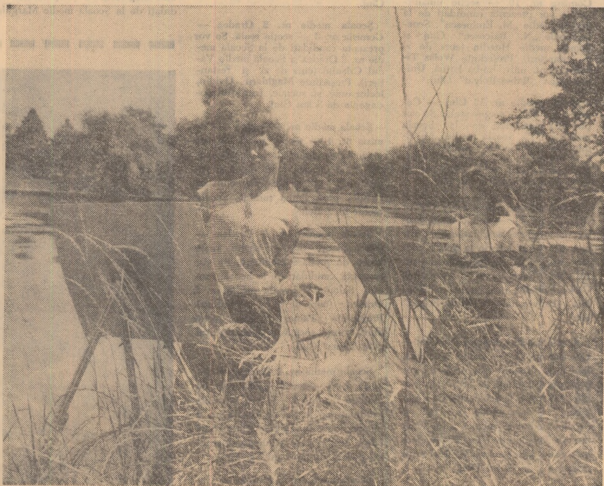
Elevii ai Școlii medii de artă plastică din Cluj, în timpul practicii la Muzeul satului din Capitală