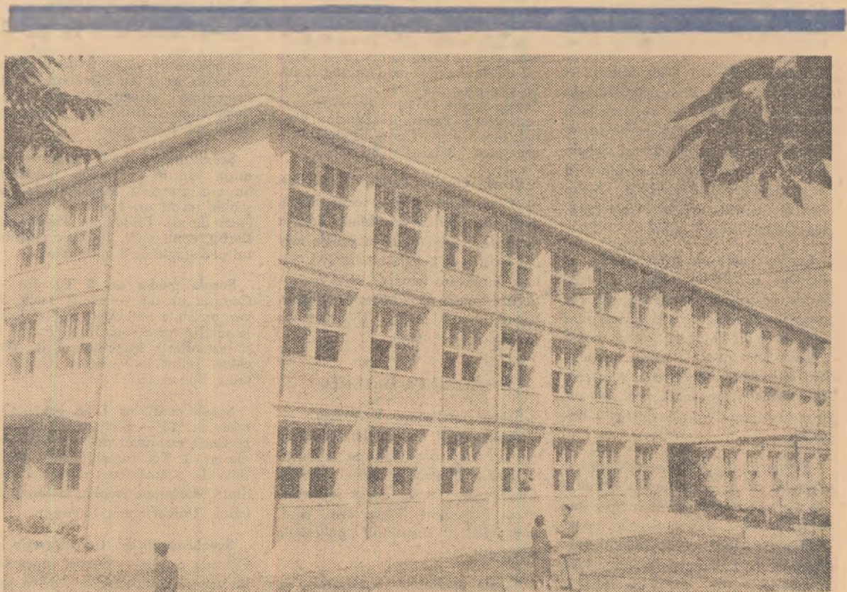
Orașul Bacău s-a înnoit cu încă o școală medie modernă, spațioasă