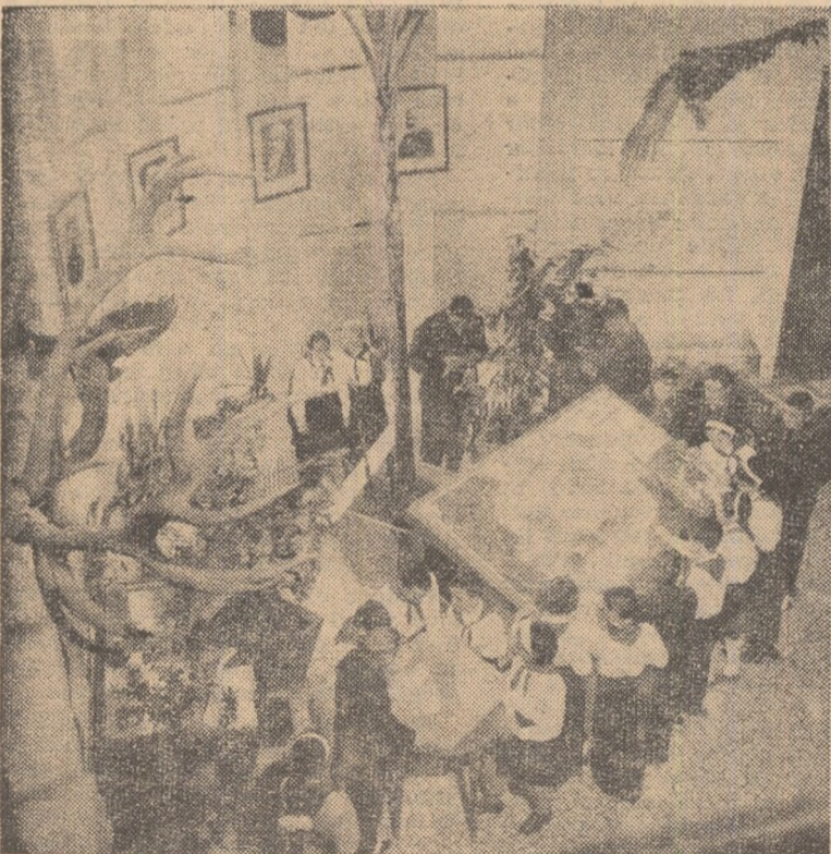
Activitate practică la colțul tinerilor naturaliști de la Palatul pionierilor din Capitală

Măsurile de reducere a programelor și manualelor din istorie pe anul școlar 1963/1964 contribuie la asigurarea conținutului științific și ideologic al lecțiilor și mai ales la evitarea supraîncărcării elevilor. Au fost scoase din programă unele lecții de istorie universală, paragrafe cuprinzînd cunoștințe ce se repetă de la o clasă la alta, noțiuni inaccesibile elevilor, amănunte, date nesemnificative, s-a restrîns volumul unor capitole și lecții ce nu puteau fi asimilate de elevi în numărul de ore ce le era acordat.