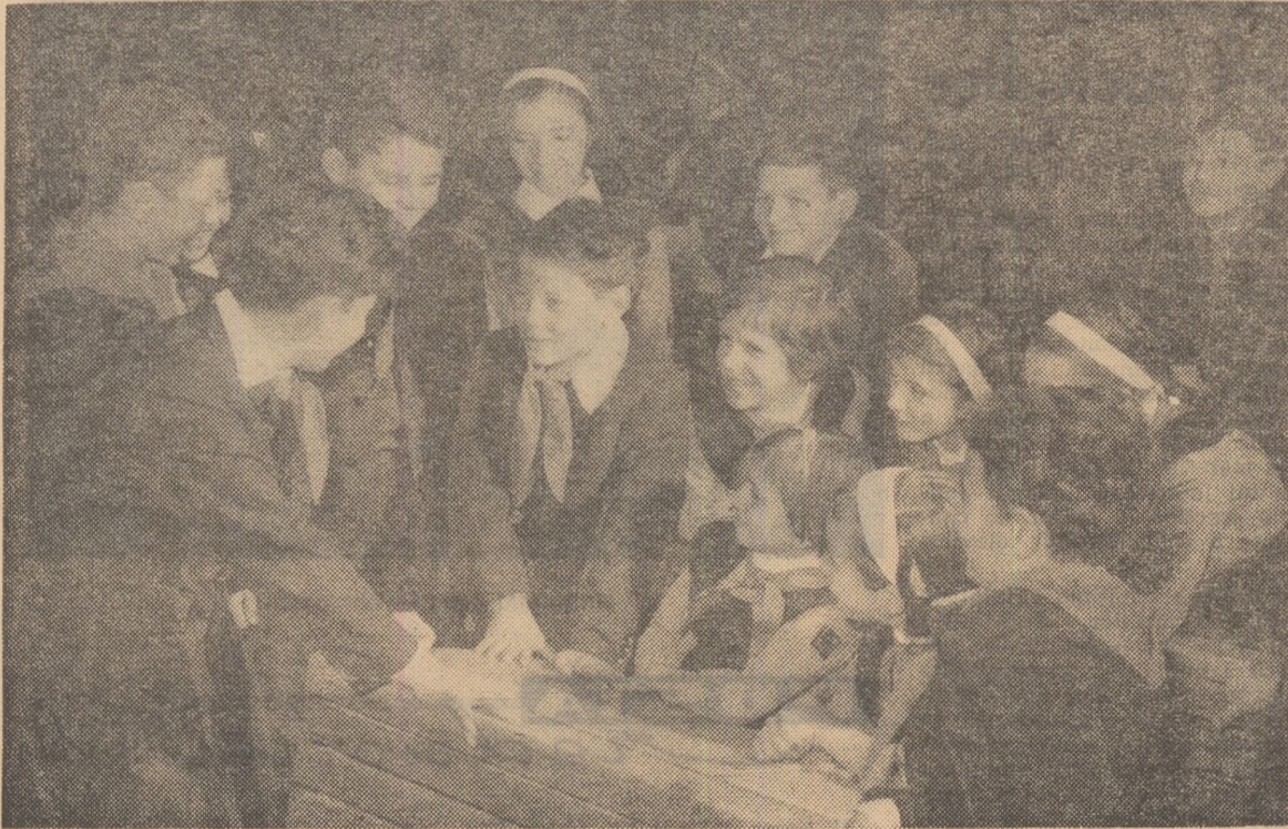
Discuție după lecție