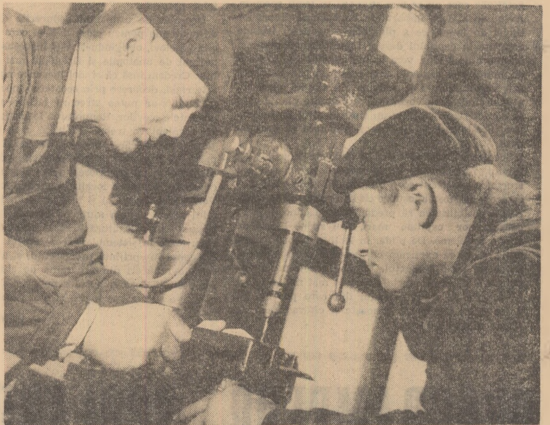
Elevii Școlii profesionale „Grivița Roșie” execută cu atenție o lucrare practică la mașina modernă de găurit instalată în atelierul de instructaj practic. Astfel ei se pot deprinde de la început cu efectuarea lucrărilor de precizie.