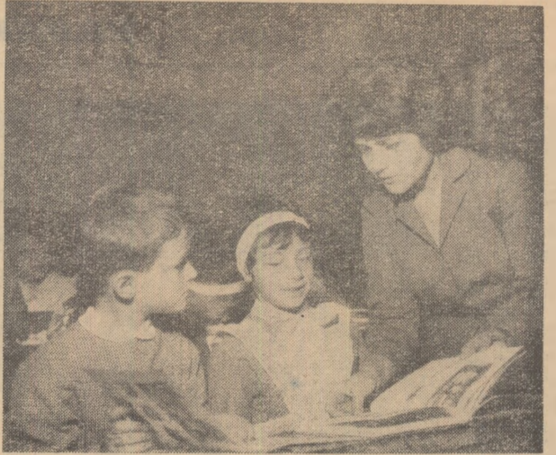
O cunoștință nouă — abecedarul