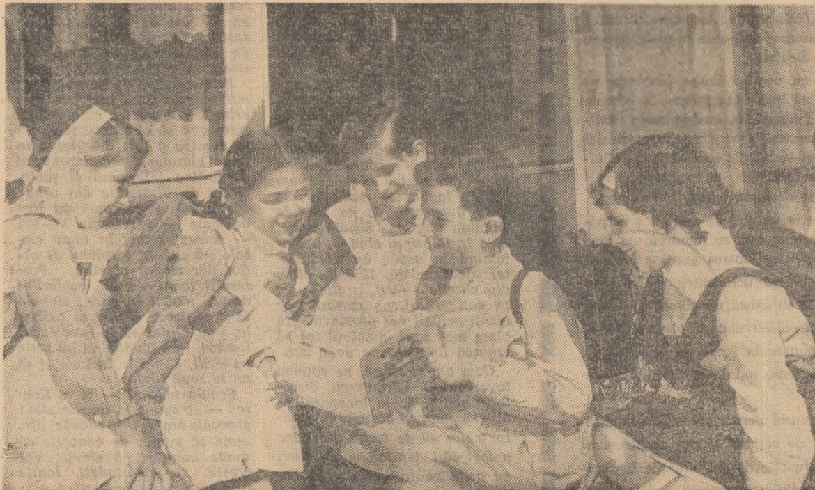
Abecedarul — o lume tainică și minunată pe care o vor cunoaște în curînd

Vizita noastră făcută în mai multe școli, acum la început de activitate, a scos la iveală multe aspecte îmbucurătoare ale muncii corpului didactic, vîdînd dragostea și atașamentul cu care învățătorii și profesorii slujesc școala. Socotim lipsurile constatate accidentale și neapărat trecătoare. Realizările pe care le-am constatat ne-au convins că nu există colectiv care să nu poată înlătura asemenea neajunsuri, care să nu poată face ca în toate domeniile să domnească progresul, să strălucească succesul depășitor.