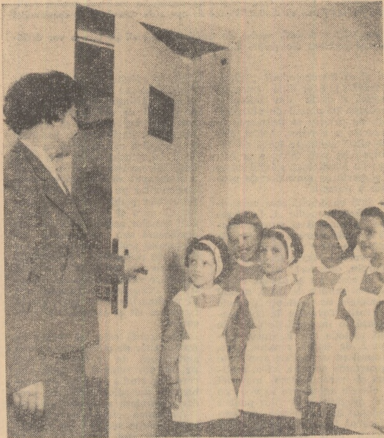
Intrați în noua voastră clasă!

Autoritatea directorului presupune un control permanent al îndeplinirii sarcinilor. Orientîndu-se prin planul comun de acțiune asupra problemelor esențiale, repartizînd diferitele probleme în funcție de posibilitățile fiecărui membru al colectivului, directorul creează condițiile respectării îndatoririlor și verificării continue a desfășurării tuturor acțiunilor din școală.