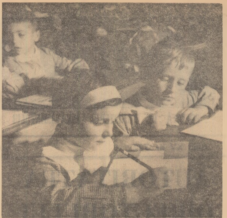
Primele încercări cer încordare și atenție