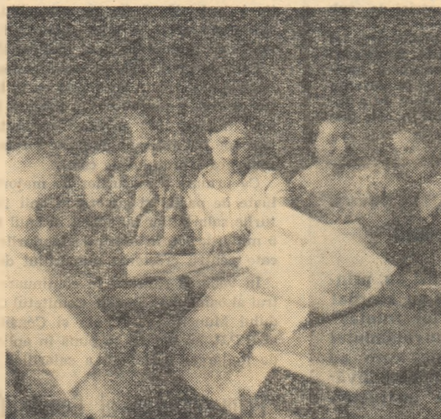
În întreaga țară, profesorii și învățătorii au citit cu bucurie noua Hotărîre a partidului și guvernului.