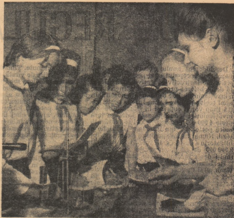
Lecție de fizică în laboratorul Școlii de 8 ani nr. 75 din București

Cunoașterea amănunțită a noilor planuri de învățămînt de către cadrele didactice, înțelegerea principiilor care stau la baza lor, strădania de a aplica în cele mai bune condiții prevederile pe care le cuprind vor contribui în mare măsură la ridicarea nivelului muncii de instruire și educare a elevilor.