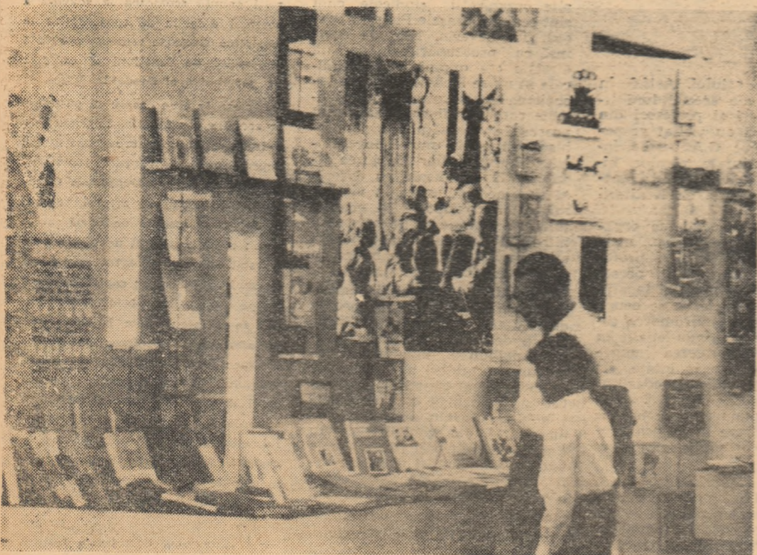
La un stand care ilustrează realizările obținute în domeniul învățămîntului