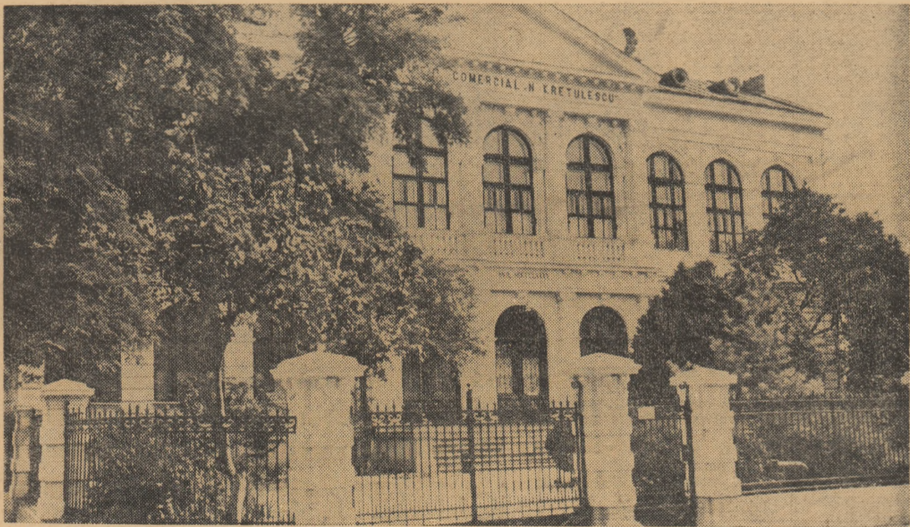
Grupul școlar „Nicolae Kretzulescu” din Capitală

Intr-o telegramă trimisă C.C. al P.M.R. și guvernului R.P. Romîne, corpul didactic și elevii grupului școlar își exprimă recunoștința față de grija permanentă pe care partidul și statul o poartă învățămîntului, angajîndu-se totodată să contribuie prin activitatea lor la dezvoltarea activității comerciale.