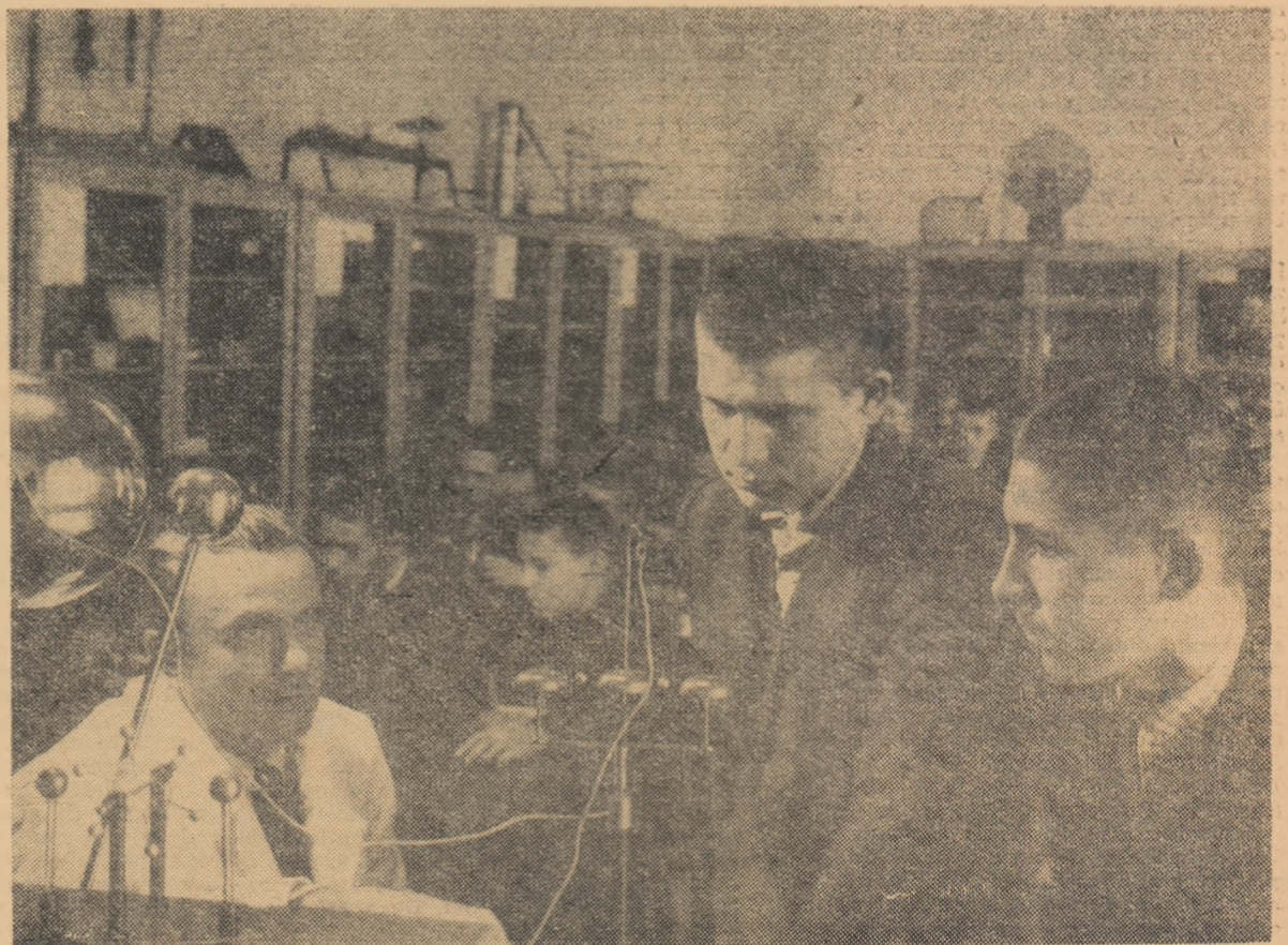
Experiențe sub îndrumarea atentă a profesorului