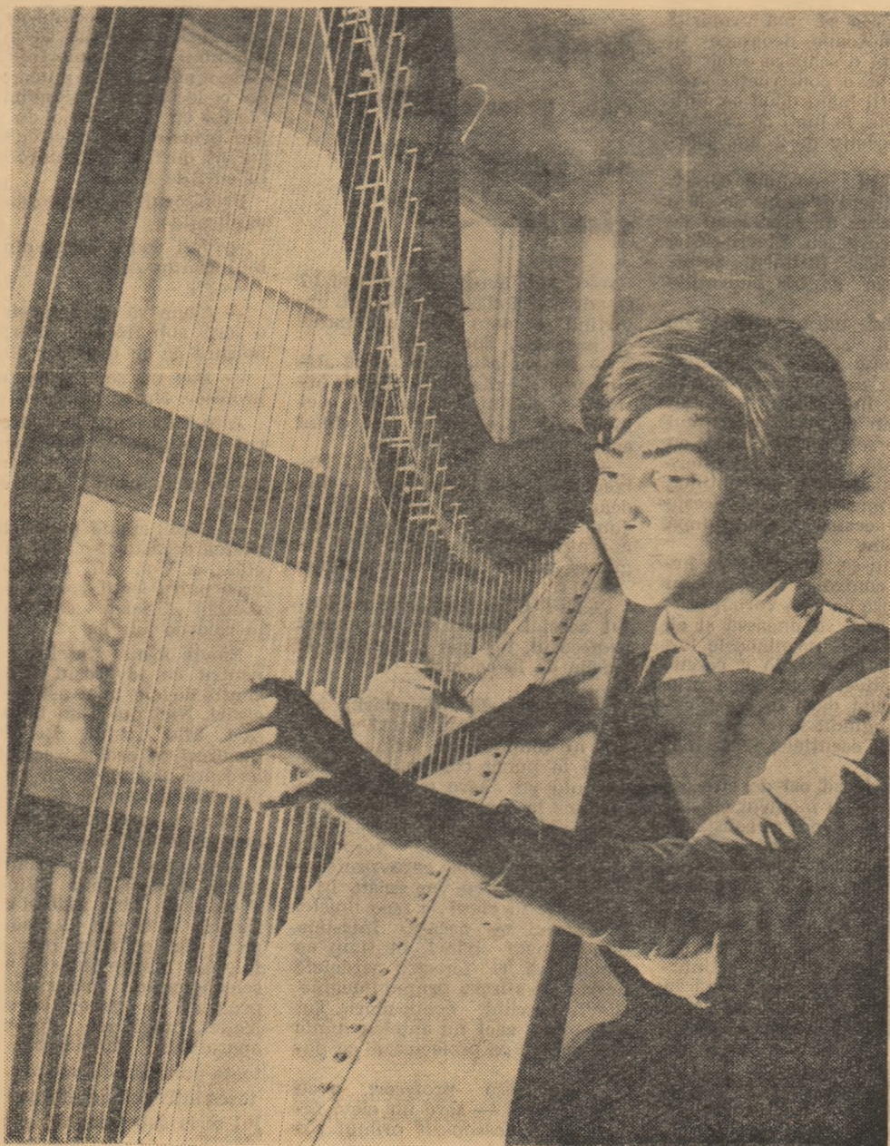
Studiu la harpă

Astăzi, în regimul democrat-popular, asemenea realizări au putut fi dezvoltate pe scara întregului nostru învățământ.