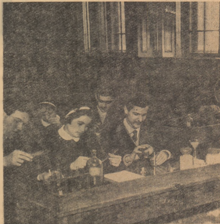
Laboratorul de chimie