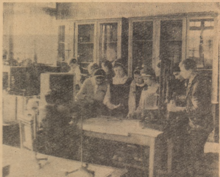
Laboratorul de fizică