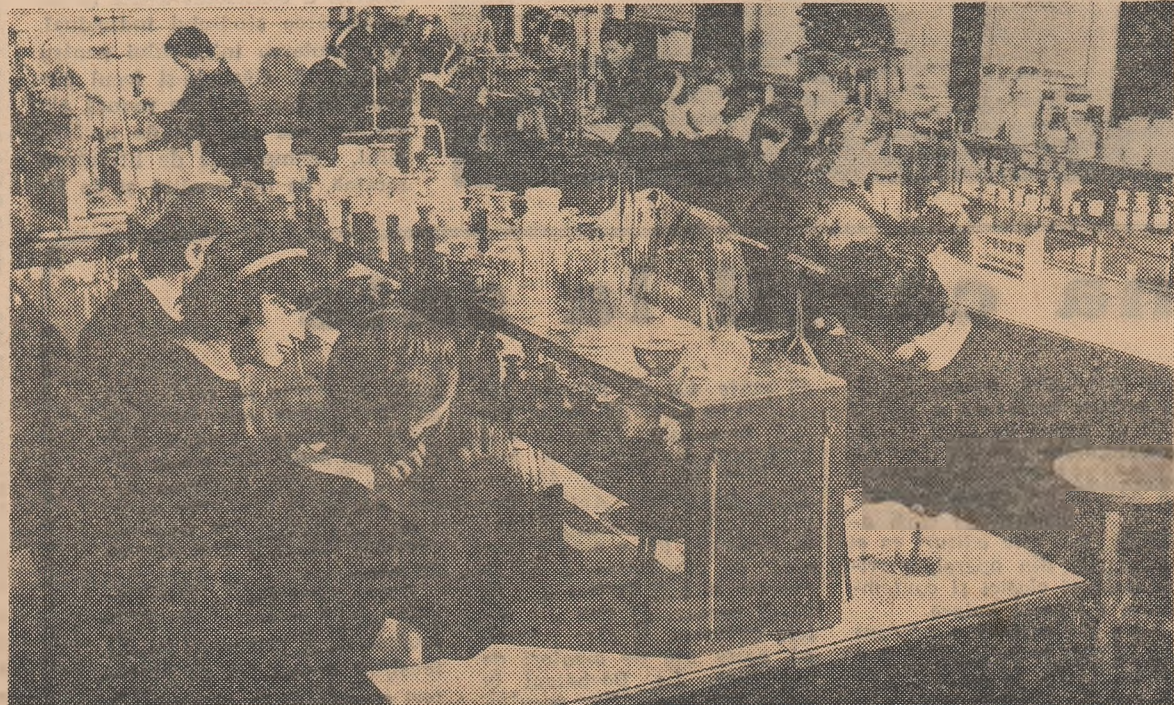
În laboratorul de chimie, bogat utilat, al Școlii medii din Marghita, regiunea Crișana