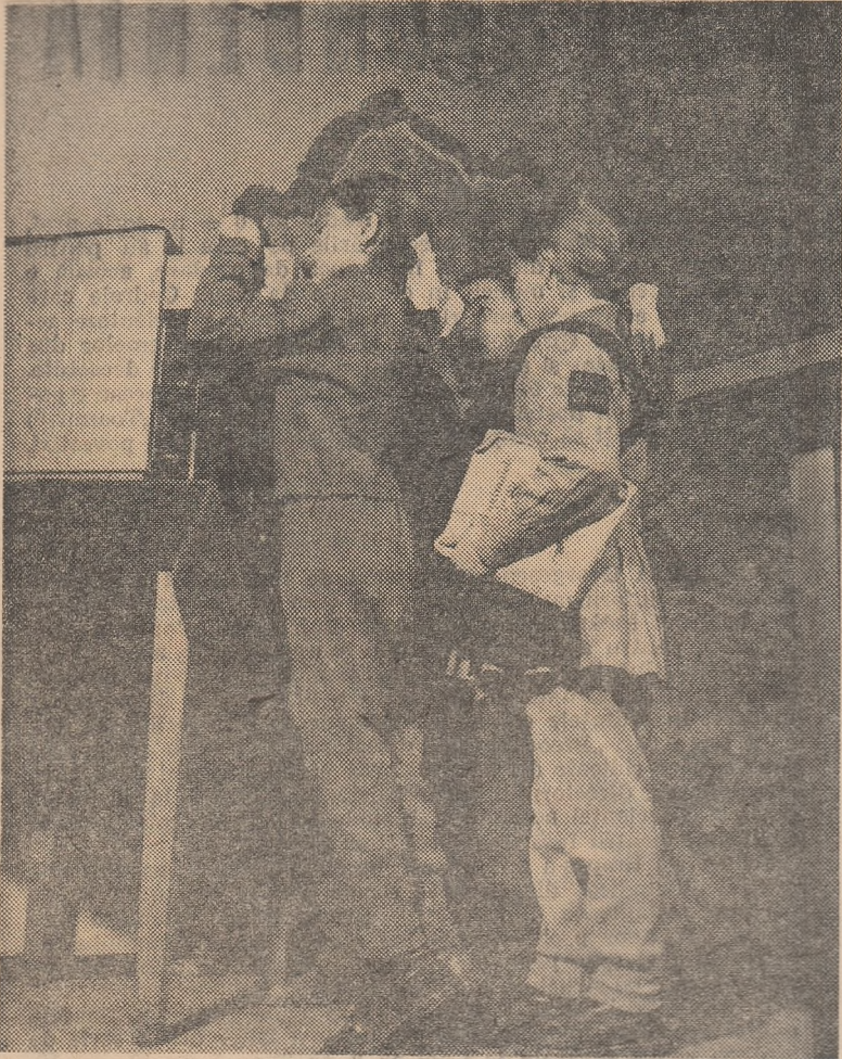
In secția pentru copii a Bibliotecii regionale din Pitești