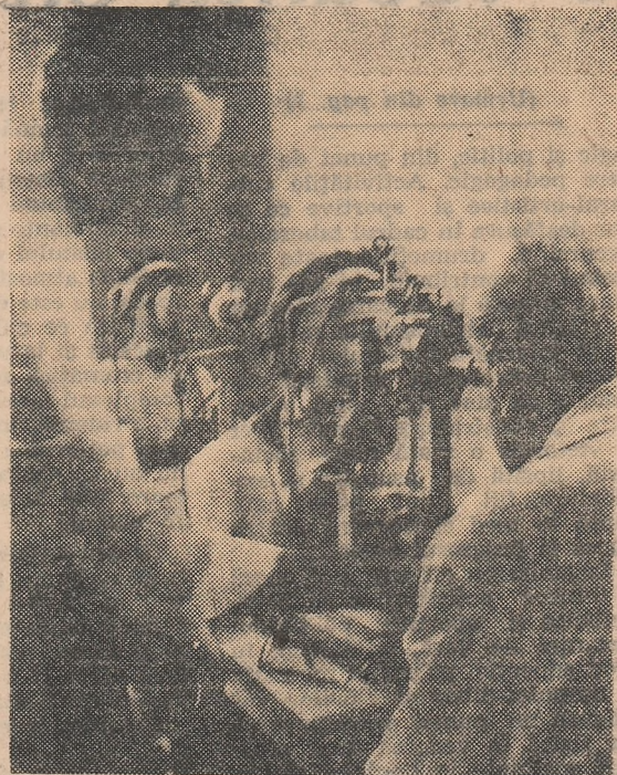
În cabinetul oftalmologic al Școlii speciale de ambliopi