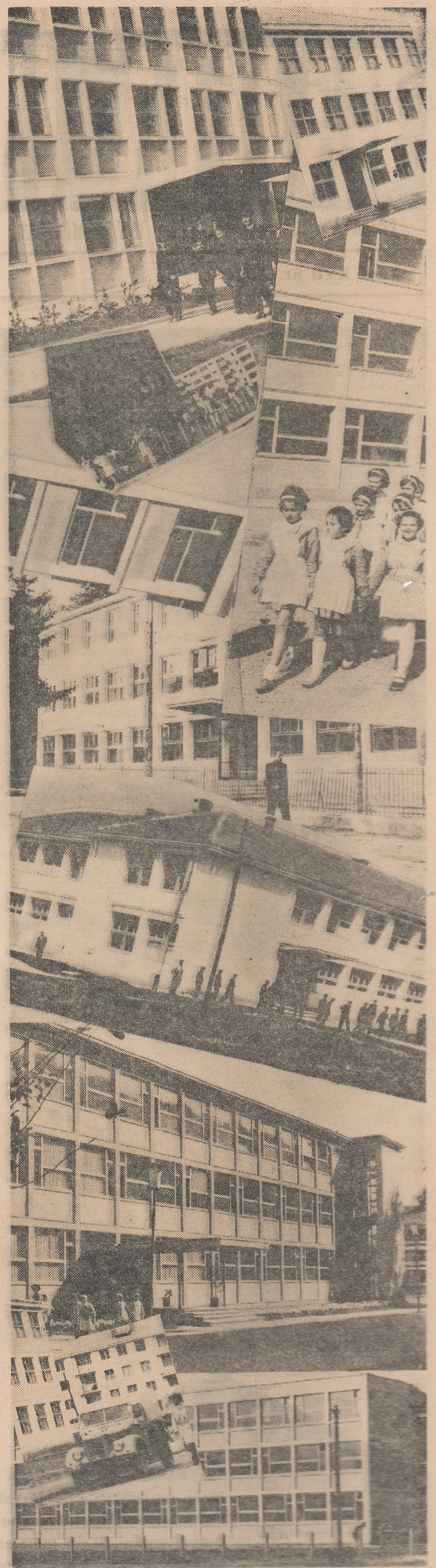
În perioada 1961—1965 au fost asigurate învățămîntului mari capacități de școlarizare. Investițiile pentru dezvoltarea bazei materiale a învățămîntului vor urma, în anii cincinalului, o linie mereu ascendentă.