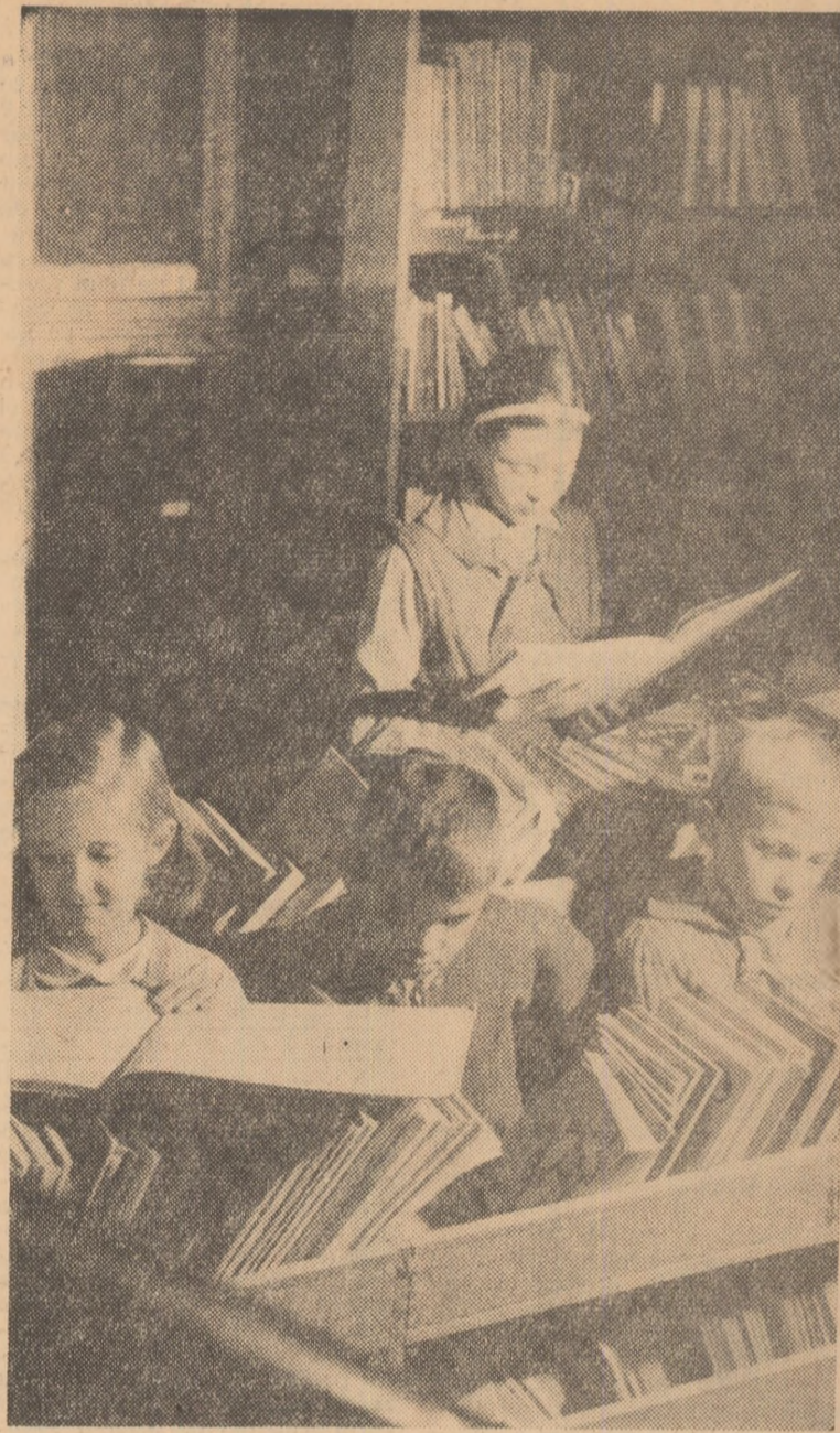
Cartea are prieteni statornici printre micii școlari.