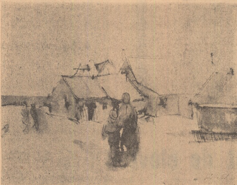
EMA GHERGHEL: Case pescărești (Techirghiol)