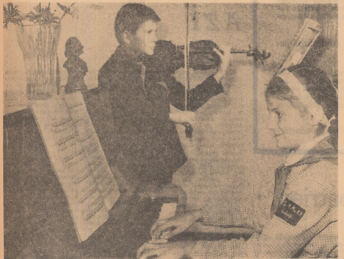
Studiu la instrument în Liceul de muzică din Gaița.