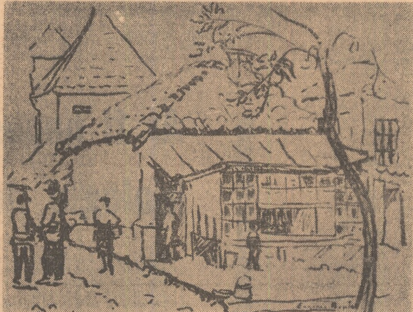
EUGENIA BRATEȘ: Kazanluc (R.P. Bulgaria)