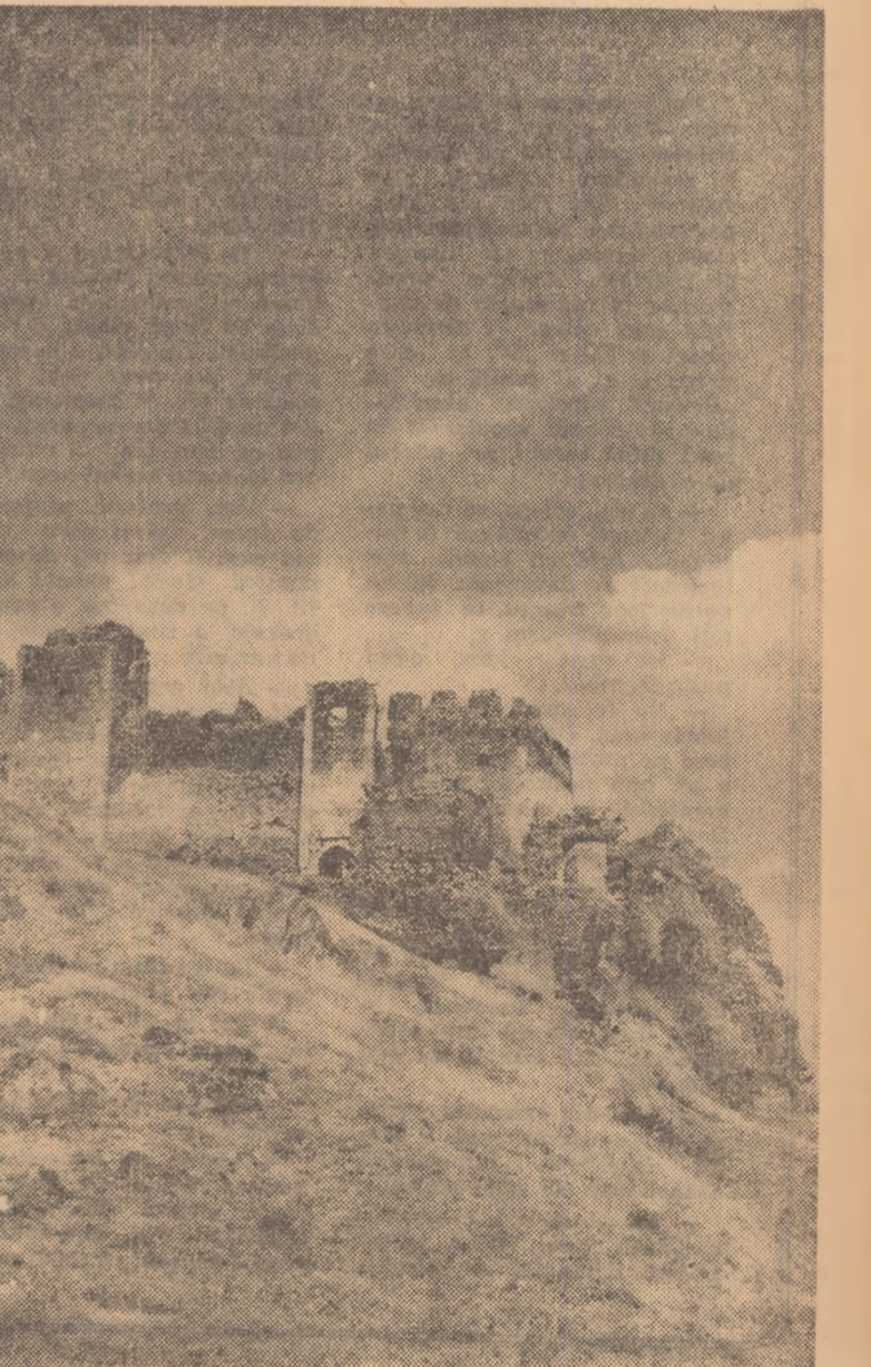
Cetatea Lipova (monument feudal de pe Muresh)