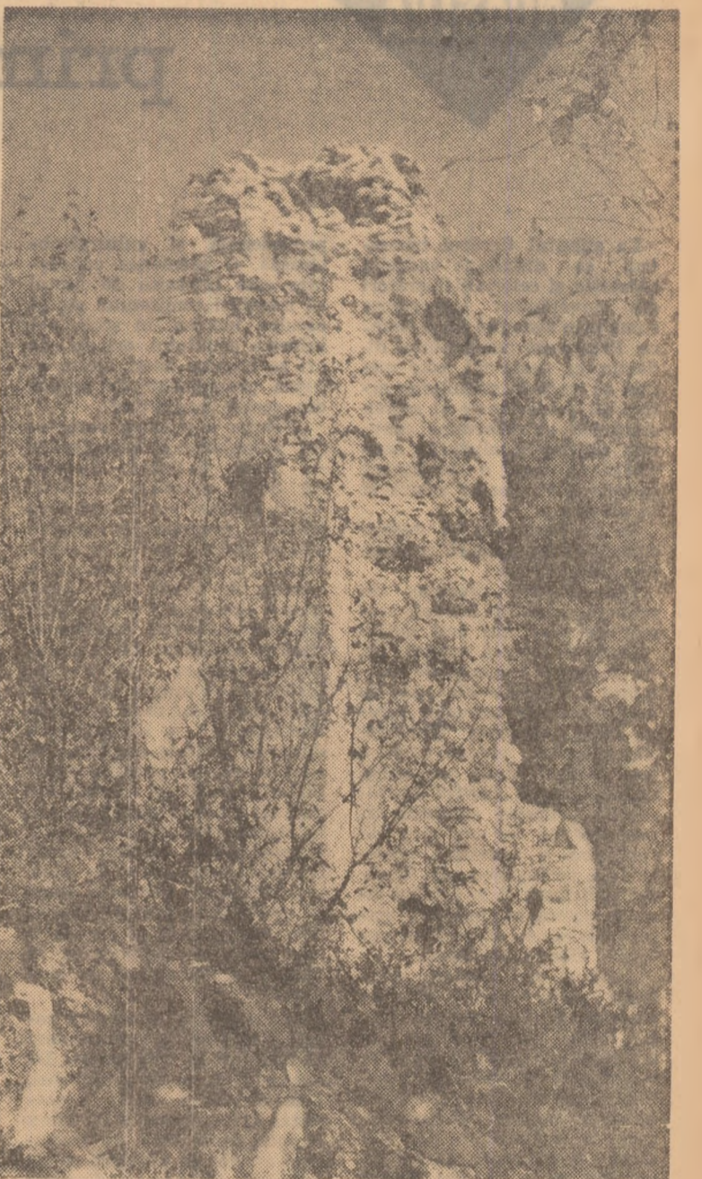
Turnul lui Sever (monument roman de la Drubeta Turnu Severin)